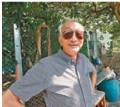
■涉事專線小巴站姓王司機直言，每次拍卡也只是「一個幾毫」，自己一定不會幹這違法事情。

發言人重申，政府十分關注優惠計劃的實施情況，並會繼續密切監察，確保優惠計劃不會被濫用，呼籲各界人士切勿以身試法。