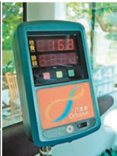
▲涉案專線小巴車廂所見，八達通機全程收費16.8元，但長者可以2元優惠乘搭。

涉案的兩名專線小巴司機分別姓陸(54歲)及姓李(67歲)，兩人屬全職司機，相互認識並入職兩年，犯案時駕駛44號專線小巴，往來屯門湖山路至上水廣場，全程車費16.8元，短途車費6.3元。他們涉嫌「欺詐」罪名，暫准保釋，分別須於7月中旬及6月中旬返警署報到；案件交由屯門警區刑事調查第五隊跟進。