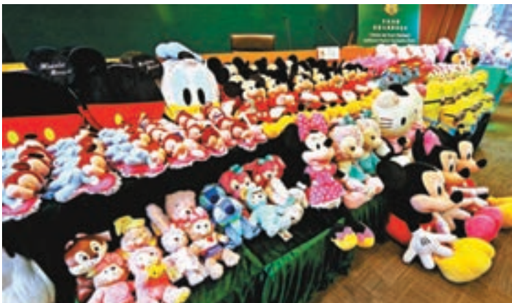
■冒牌公仔多為假冒熱門受歡迎卡通人物。香港文匯報記者劉友光攝