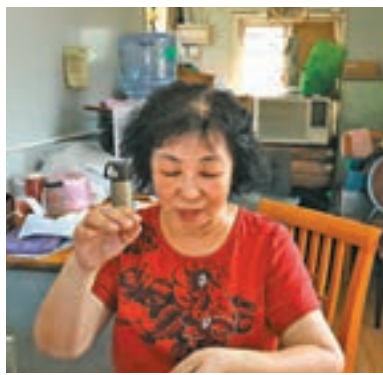
■涉事專線小巴站頭姓潘女主管表示，所有司機入職時也會給予有關守則閱覽了解。