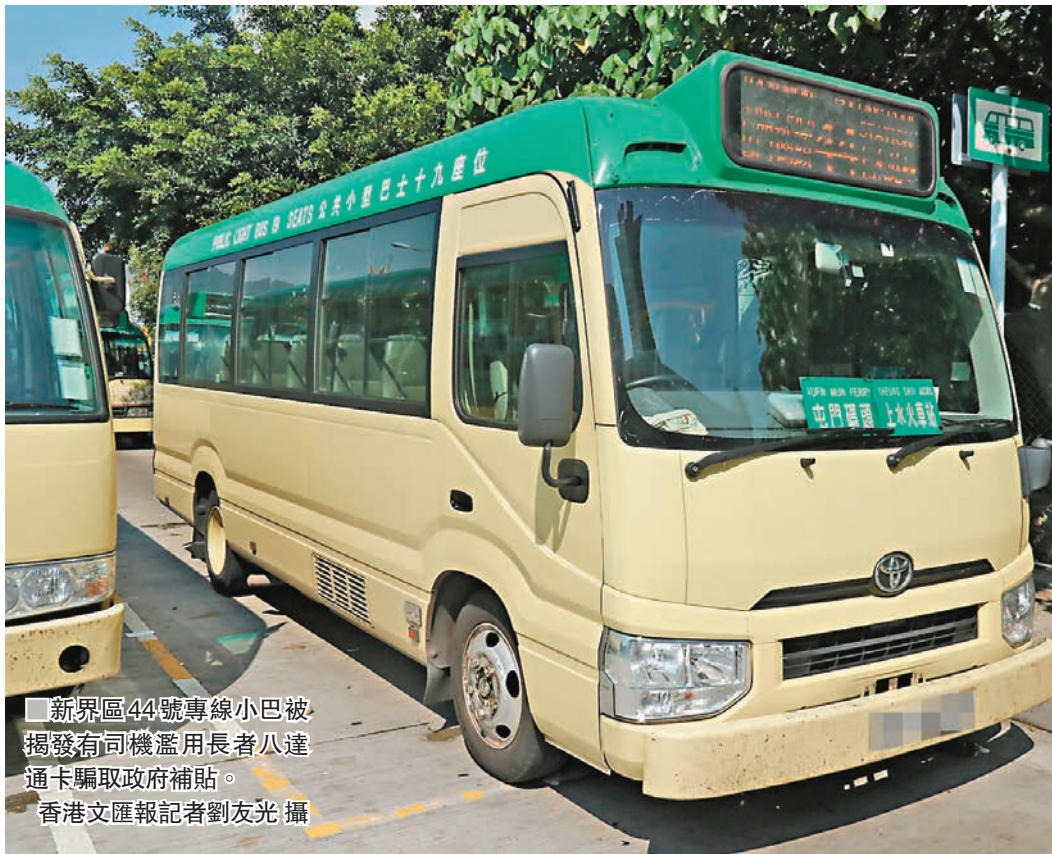
新界區44號專線小巴被揭發有司機濫用長者八達通卡騙取政府補貼。

香港文匯報訊（記者 蕭景源、劉友光）兩名專線小巴司機，疑為增加收入，自行拍長者八達通卡扮長者搭車呃政府錢，涉嫌在半年間以長者八達通拍卡約2,800次，以騙取政府補貼，涉款逾4萬元。運輸署透過監察機制發現異常，轉介警方調查。警方日前以涉嫌欺詐罪名，在上水和屯門拘捕兩名司機，這是自2015年長者2元乘車優惠擴展至專線小巴後第二宗同類案件，當年有司機以長者八達通卡拍卡8,000次騙取政府補貼被捕。