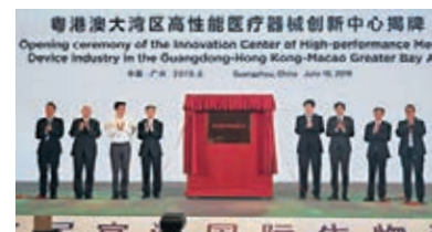
創新中心揭牌儀式現場。

2010年以來,中國醫療器械市場以年複合增長率20%的速度成長,預計2020年將達7,600億元人民幣的市場規模。生物材料和醫療器械在廣東首發