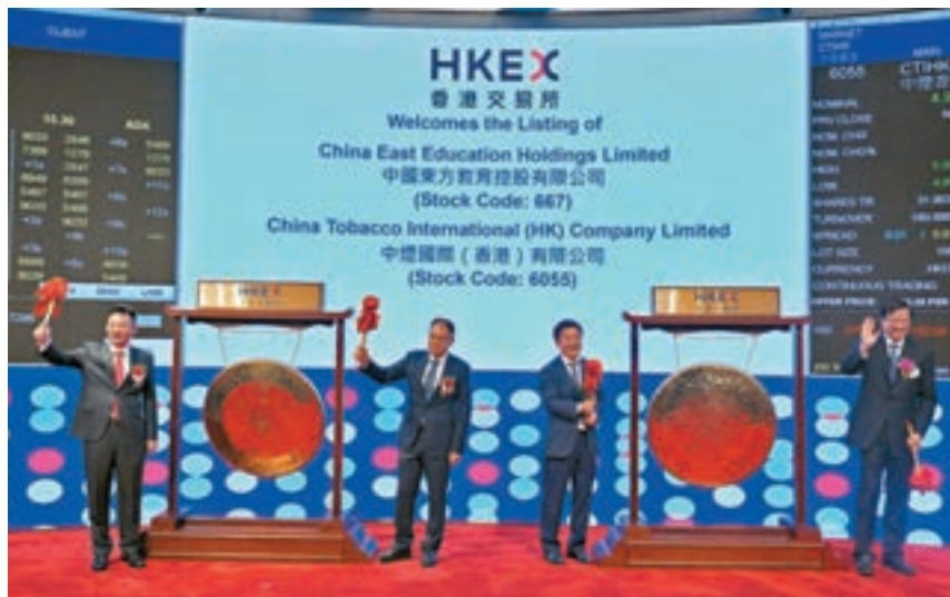
兩隻新股昨掛牌。國家煙草專賣局局長、中國煙草總公司總經理張建民（右一）、中煙香港董事會主席邵岩（右二）及中國東方教育董事會主席吳偉（左一）和中國東方教育非執行董事吳俊保（左二）共同敲響上市銅鑼。

個月後「破7」的機會頗大。不過他認為，若人民幣匯價「破7」，人行貨幣政策反而可作更多靈活操作，因此「破7」其實不是壞事。