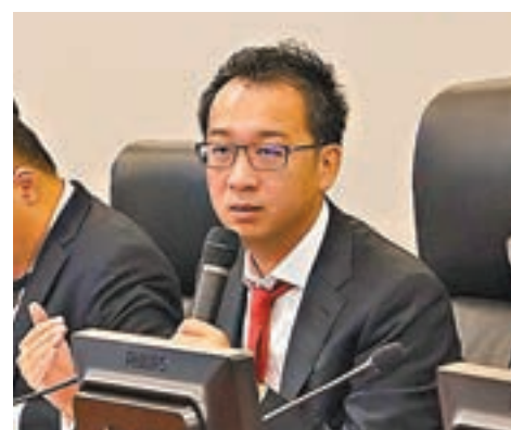
洪灝預料，港股至今已大致反映中美貿易戰這項負面因素。

人幣「破7」並不是壞事 此外，中美貿易戰亦影響人民幣匯率。洪灝指，現場市場數據或預示人民幣兌美元3