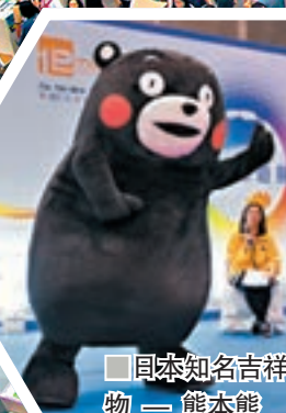
日本知名吉祥物——熊本熊

第33屆香港國際旅遊展於今天(6月13日)至6月16日在會展舉行，來自56個國家和地區的約680家參展商匯聚展覽會，展出郵輪、探險等主題遊產品，展覽於13日和14日面向業界和專業人士開放，15日和16日面向公眾開放，不少展館都以其地方的特色作為主題，並設舞台舉行特色精彩表演，加上現場的互動遊戲，以供參觀者遊玩，了解當地的著名景點，以換領特色小禮物及着數優惠等，盡興而歸。 文、攝(部分)：雨文