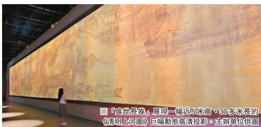
「盛世長卷」展現一幅近5米高、30多米長的《清明上河圖》巨幅動態高清投影。

另一全新項目「宋『潮』遊樂園」則專為親子群體打造，展區設置一系列闖關任務，包括手繪團扇、臨摹年畫、體驗元宵燈籠猜謎及活字印刷拓印宋詞