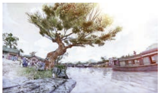
「汴河碼頭」影片描繪汴河生動景象，令參觀者有如置身其中。