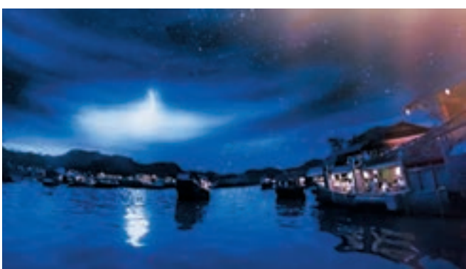
「汴河碼頭」將汴河從白天到傍晚的生動景象展現，令參觀者感受時間轉變。