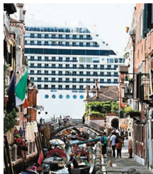
民眾批評郵輪停泊會阻礙景觀。

意大利威尼斯的朱代卡運河上週日發生郵輪失控撞向碼頭及觀光船，造成5人受傷，事件觸發當地5,000居民昨日上街示威，要求禁止大型郵輪駛入威尼斯的狹窄水道，危及威尼斯景觀及居民生活，並破壞當地地基。