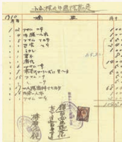
研究員通過收據等文件發現計劃。