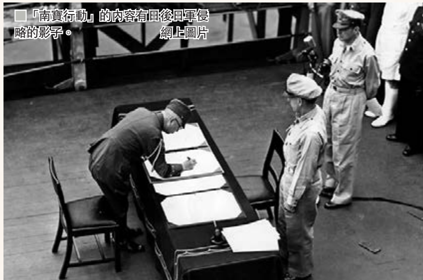
「南寶行動」的內容有日後日軍侵略的影子。