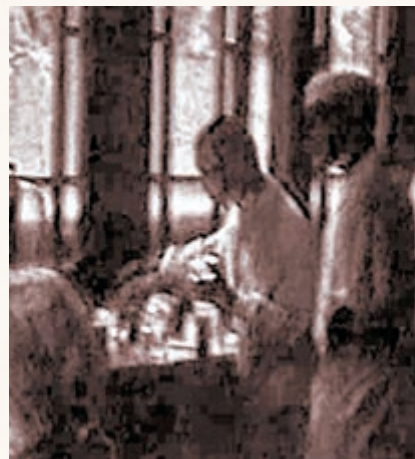
日軍曾於新加坡研究生化武器。