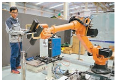
報告指去年中國高技術製造業加快增長。圖為科研人員調試機械手。資料圖片

香港文匯報訊 (記者 王珏 北京報道) 中國社科院工業經濟研究所報告預計，今年全國規模以上工業增加值增速為5.9%至6.4%的概率較大。報告還稱，中美貿易摩擦增大了外部環境的不確定性，對中國工業經濟發展構成了較大威脅，但結合其他工業經濟運行的數據分析，中美