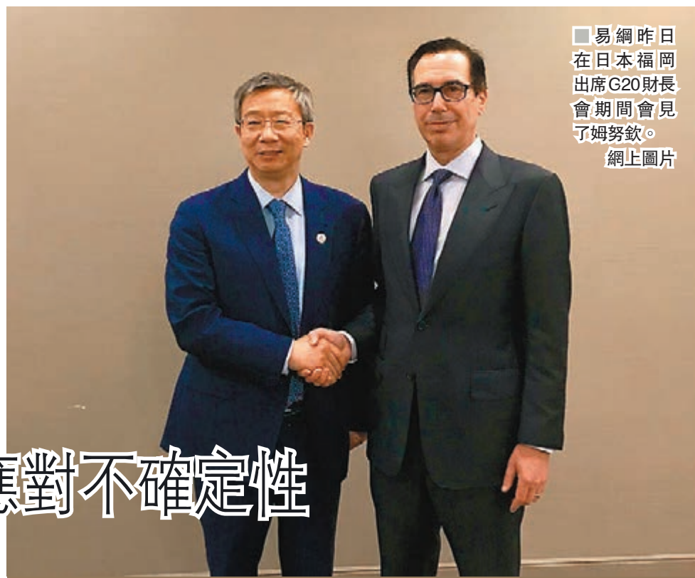
易綱昨日在日本福岡出席G20財長會期間會見了姆努欽。

文章強調，正告那些崇美媚美恐美者，別再做美國政府霸凌的幫兇，別再試圖用「投降論」瓦解中國人的抵抗精神，執迷不悟、一意孤行的前方是萬丈深淵。也希望國人擦亮眼睛，認清「投降論」者的真面目和險惡用心，人人喊打，讓他們再也不敢出來招搖撞騙、蠱惑人心。 文章最後說，一起重溫一首詩：「假使我們不去打仗，敵人用刺刀殺死了我們，還要用手指着我們骨頭說：看，這是奴隸！」