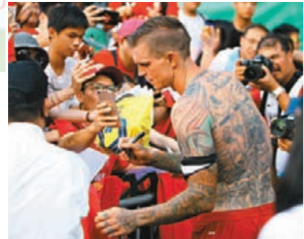
利物浦名宿艾加除為球迷們簽名外更送上球衣。