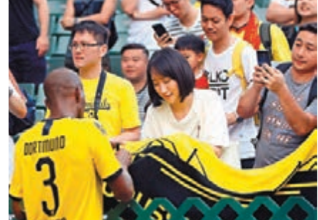
一眾多蒙特名宿賽後為球迷簽名留念。

香港文匯報訊(記者 郭正謙)雖然昨日氣溫高達33度,不過炎熱天氣無阻一眾球迷的熱情,有近一萬五千名觀眾入場欣賞利物浦傳奇隊對多蒙特傳奇隊的表演賽,最終前者以3:2勝出,雙方合力炮製五個入球,一眾利物浦名宿賽後更高舉複製的歐聯冠軍獎盃與球迷一起振臂高呼,令這場友賽猶如利物浦六奪歐聯冠軍的慶典。