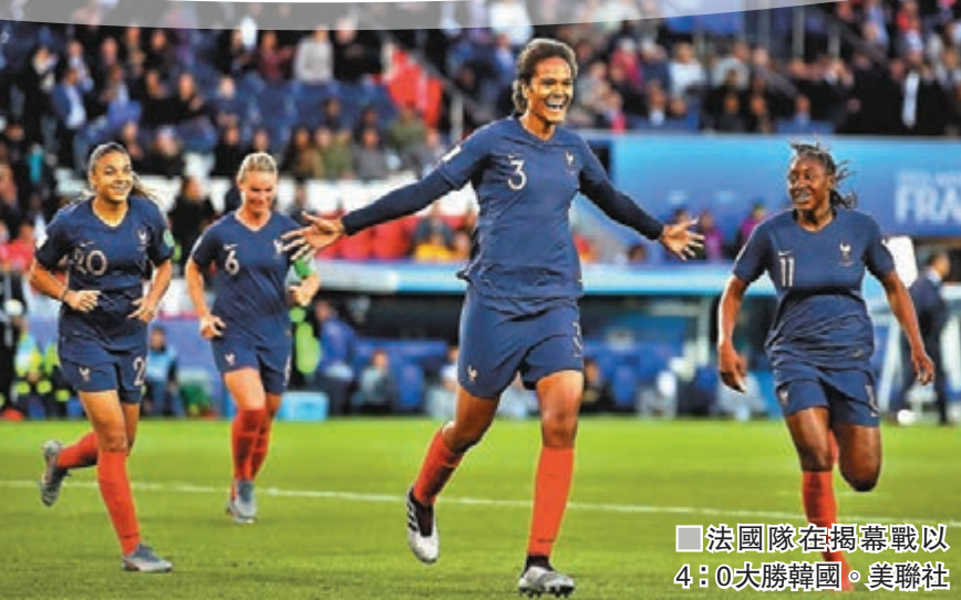
法國隊在揭幕戰以4:0大勝韓國。