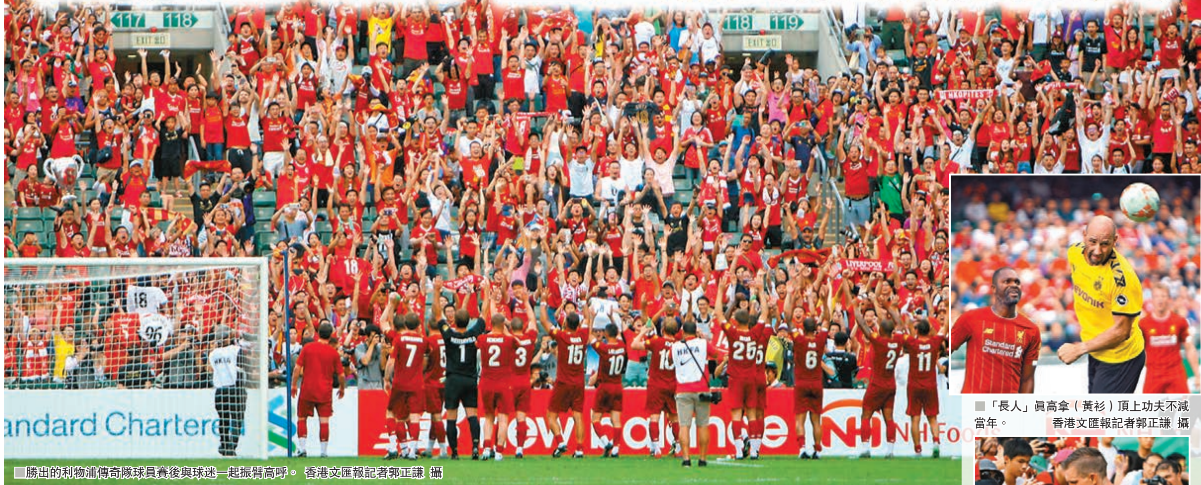
勝出的利物浦傳奇隊球員賽後與球迷一起振臂高呼。