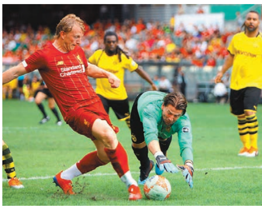
利物浦名宿古治(左)與多蒙特傳奇隊門將維丹費拿鬥法。

比賽結果只是其次,利物浦球迷慶祝球隊勇奪歐聯冠軍才是重點,比賽期間「紅軍」球迷已不斷高唱利物浦今季最紅打氣歌「Allez! Allez! Allez!」,一眾名宿賽後更特意走到觀眾席前高舉複製的歐聯冠軍獎盃,引得全場「球迷」振臂高呼,將現場氣氛推至最高峰。已多次來港的路爾斯加西亞表示,雖然在炎熱天氣下作賽有點辛苦,不過球場氣氛卻令他非常感動:「香港球迷很熱情,在比賽期間一直為我們打氣,希望他們好好享受這場賽事,現場的氣氛很好,令我想起還沒退役前的比賽日子,希望很快可以和香港球迷再次見面。」