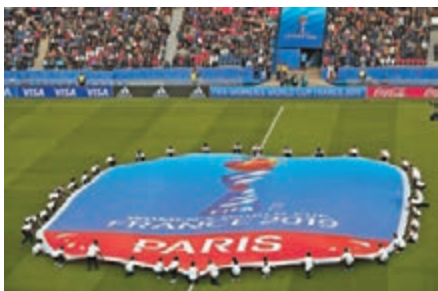
女足世界盃香港時間昨凌晨在法國開幕。

三次參加世界盃,當前世界排名第14。當晚的比賽,法國隊全程佔據主動。上半場第9分鐘,韓國隊左路失誤丟球,亨利拿球後突破底線附近倒三角傳到禁區,勒索米爾中路跟進射門得手,這也是本屆世界盃首個進球。在第35分鐘和上半場補時第2分鐘,身高1.87米的法國隊後衛內納德先後兩次依靠頭球破門;下半場第85分鐘,亨利左路拿球內切後右腳打出弧線球破門,幫助法國隊以4:0鎖定勝局。法國女足主教練迪亞克爾賽後表示,整場比賽按照既定的計劃進行。「球隊進入狀態很快,第二粒進球被判無效後並沒有受到太大影響,上半場幾乎就已經奠定勝局。」