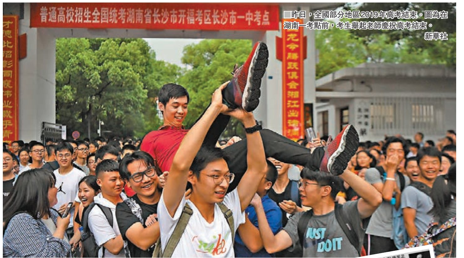
昨日,全國部分地區2019年高考結束。圖為在湖南一考點前,考生舉起老師慶祝高考結束。

在被全國I卷中的求維納斯身高的題目刷屏的同時,全國II卷表示不服,並送上了一道被吐槽為「物理題」的數學題以及一道稜數為48的半正多面體「鑽石題」。「天體運動?參數方程?立體幾何?」考生們對此紛紛留言表示想哭。此外,熱搜裡被頻繁點到的「三朵雲」題目則來自全國III卷,有網友在微博裡畫出三朵雲形狀,並P圖稱「這是什麼七彩祥雲?」、「失去理智」等。據網友稱,解「三朵雲」需要用到柯西不等式,而這一知識超出了大部分高三生的學習範疇。