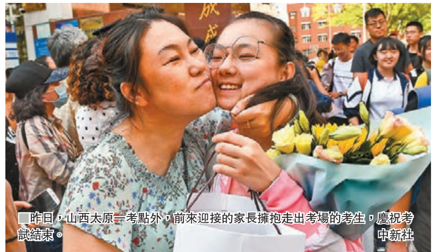
昨日,山西太原一考點外,前來迎接的家長擁抱走出考場的考生,慶祝考試結束。

香港文匯報訊(記者朱輝北京報道)被譽為「不拚爹不看臉」、「人生最後一場公平競賽」的2019年高考昨日下午在全國部分地區落下帷幕。從揭曉的各類語文作文題目中不難發現,今年不論是全國卷還是北京、天津等地方卷,都重在喚起考生心底的家國情懷,並兼顧全球化下的時代性與責任性。