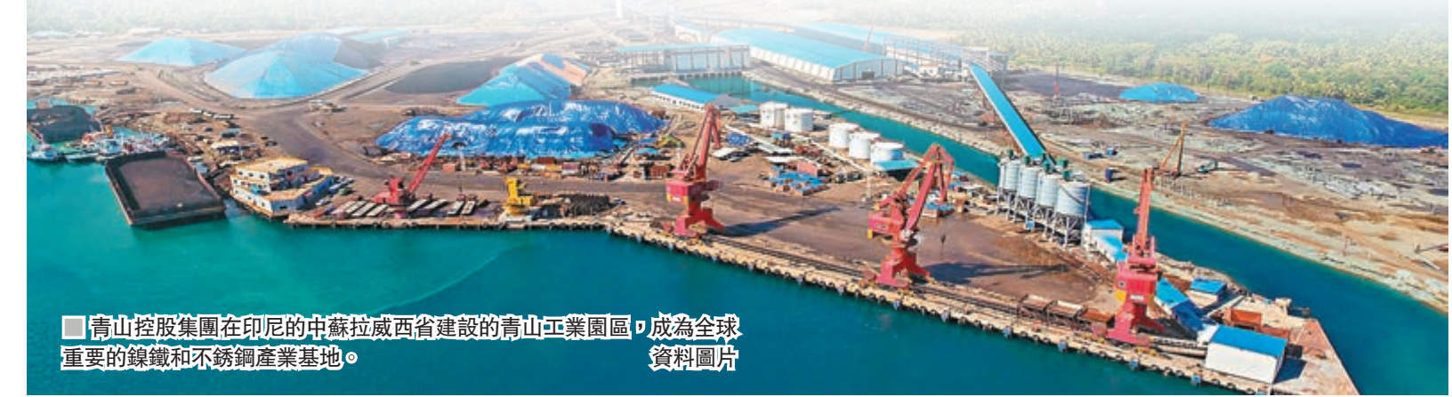
■青山控股集團在印尼的中蘇拉威西省建設的青山工業園區，成為全球重要的鍊鐵和不銹鋼產業基地。資料圖片

印尼豐富的礦產許給青山控股一個篤定的產業未來，而青山控股許給當地百姓一個美好的生活願景，這是一個雙贏戰略。「我們挖掘的不僅是原礦，而且是兩國經貿交流的機會和潛力；冶煉的不僅是鍊鐵，而且是兩國人民合作友好的成果和信心。」