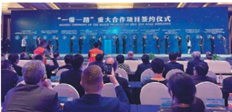
■浙江省推進「一帶一路」建設大會昨日在寧波召開，總投資過千億的20個項目在大會上簽約。

香港文匯報訊（記者 俞畫 寧波報導）浙江省推進「一帶一路」建設大會昨日在寧波召開，來自印度尼西亞、立陶宛、盧森堡、土庫曼斯坦、斯洛伐克、肯尼亞、約旦、泰國、阿曼、捷克等60個國家140多位外賓，200餘名中外企業家代表出席。現場簽約項目20個，總投資超143億美元（約合港幣1,121億元）。會議也首次發佈了「一帶一路」倡議提出六年來浙江省推進建設成果清單，2013年至2018年建成的十餘個境外經貿合作區帶動東道國就業超6萬人。