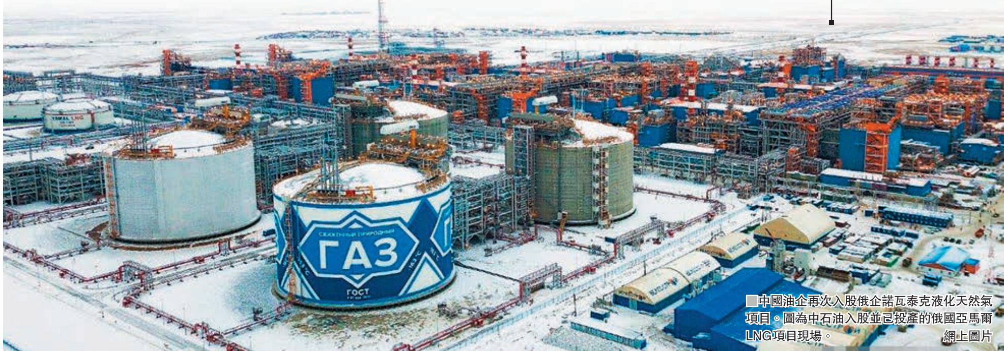
中國油企再次入股俄企諾瓦泰克液化天然氣項目。圖為中石油入股並已投產的俄國亞馬爾LNG項目現場。

香港文匯報訊（記者海巖北京報道）在中國國家主席習近平對俄羅斯進行國事訪問期間，中國兩大石油公司與俄羅斯最大獨立天然氣生產商簽訂北極LNG 2項目（液化天然氣）的股權購買協議。此前，中國石油與俄企已合作實施同於北極圈的亞馬爾LNG項目，這次再下一城，可見中俄北極能源合作加速推進。