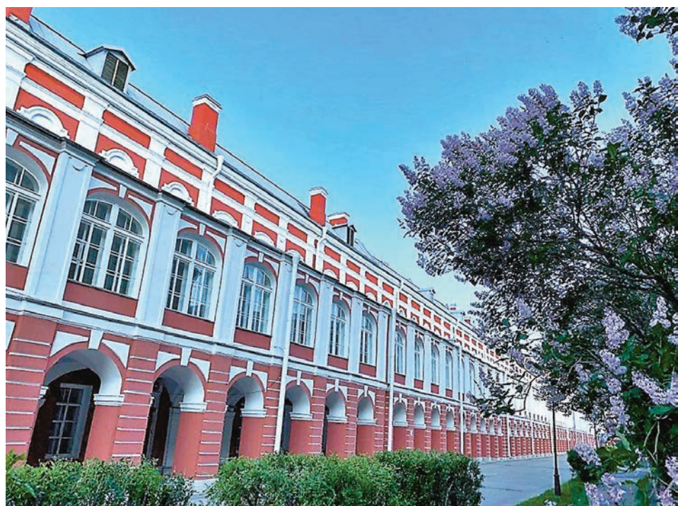
■聖彼得堡國立大學創建於1724年，坐落在聖彼得堡瓦西里島。 網上圖片