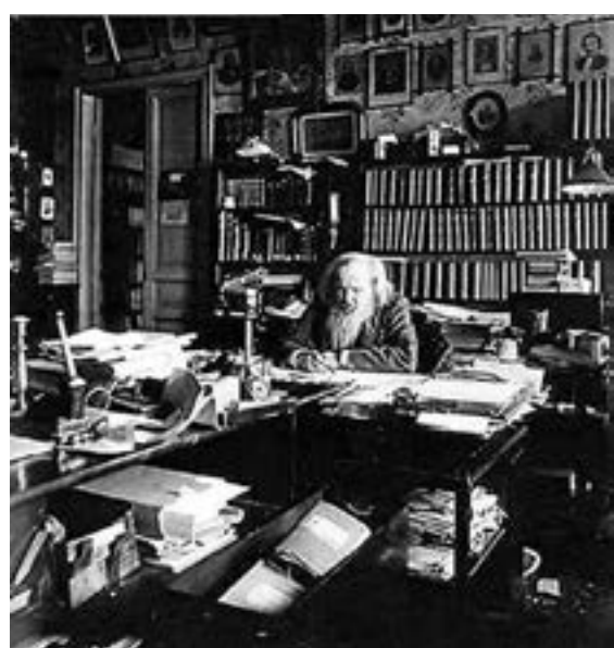
■工作室擺放着門捷列夫的這張工作照。 中新網