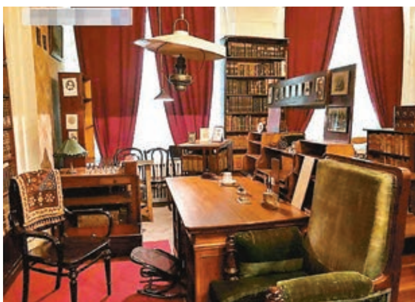
■門捷列夫曾在聖彼得堡國立大學任教，這是他的工作室。