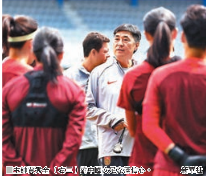
主帥賈秀全(右三)對中國女足充滿信心。