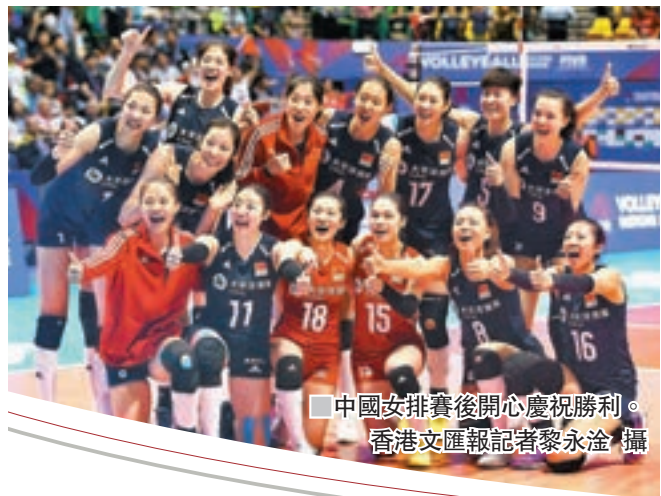
中國女排賽後開心慶祝勝利。

香港文匯報訊(記者黎永淦)「國際排球聯會女子排球聯賽」香港站賽事昨天降下帷幕，中國女排在先失兩局的情況下絕地反擊，以3：2反勝意大利，報復世錦賽一敗之仇，總排名也超越對手升上第三位。