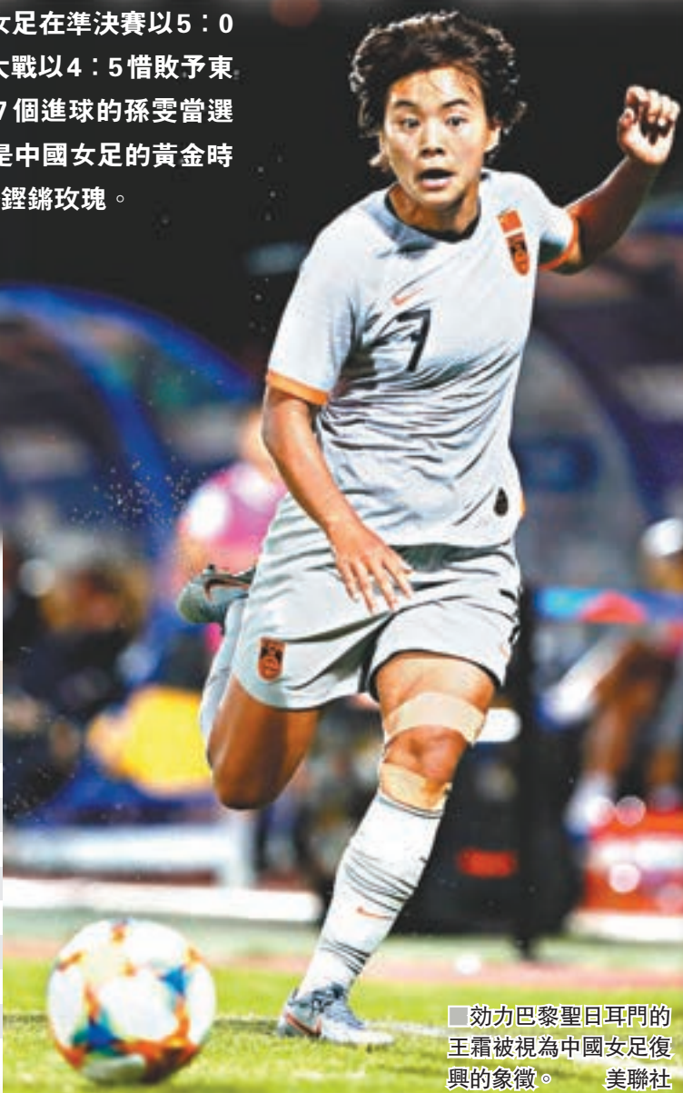
效力巴黎聖日耳門的王霜被視為中國女足復興的象徵。

20年前的美國女足世界盃，中國女足在準決賽以5：0橫掃衛冕冠軍的挪威，決賽中12碼大戰以4：5惜敗予東道主美國隊獲得亞軍，賽事中攻入7個進球的孫雯當選國際足聯「世紀女足最佳球員」。這是中國女足的黃金時代，她們留下了一個響亮的名字——鏗鏘玫瑰。