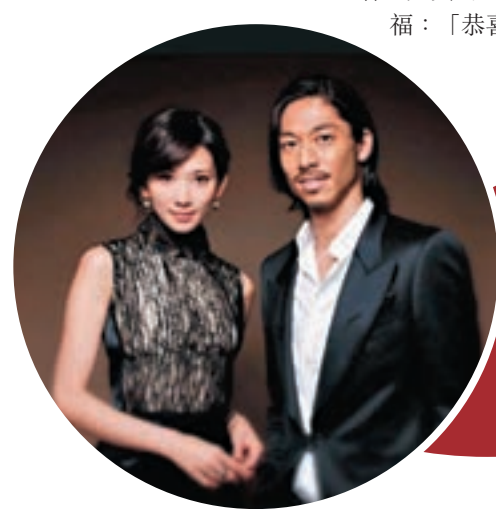
■林志玲與AKIRA 8年前主演舞台劇相識。網上圖片