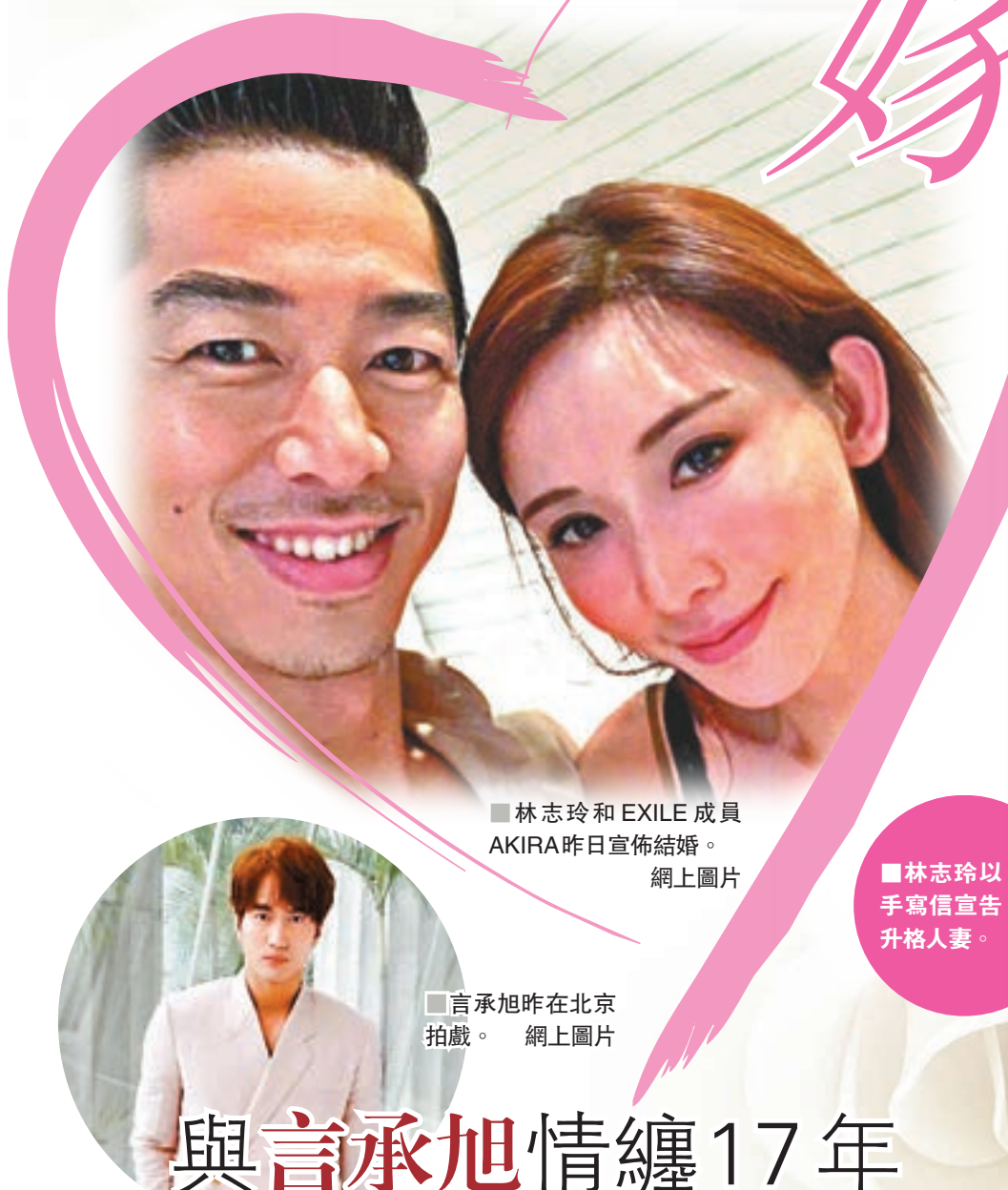
■林志玲和EXILE成員AKIRA昨日宣佈結婚。

香港文匯報訊（記者 凡文）現年44歲的「台灣第一名模」林志玲和37歲日本男團EXILE成員AKIRA昨日宣佈閃婚，並同時在台灣、日本發表聲明，震驚娛樂圈。兩人2011年因舞台劇《赤壁~愛~》扮演夫婦相識，並在去年底開始交往。雙方先是在昨日在台灣註冊，稍後亦會在日本東京辦理結婚登記，林志玲從此告別「黃金剩女」身份！而舊愛言承旭聞婚訊感驚訝！