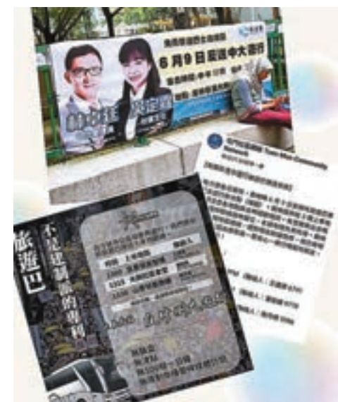
民主黨立法會議員林卓廷及「本土派」組織成員均宣稱9日會包車免費送人去遊行。

對於反對派各組織不擇手段催谷民眾在9日當天參與遊行的行為，香港文匯報記者訪問了一些當地居民，不少居民表示，他們知道反對派此舉是想拉攏一些對《逃犯條例》修訂不太知情的街坊，參與破壞香港社會穩定的所謂「遊行」，「佢哋想交數嘍，佢哋要呢啲街坊去啦！我哋唔會上當嘍！」