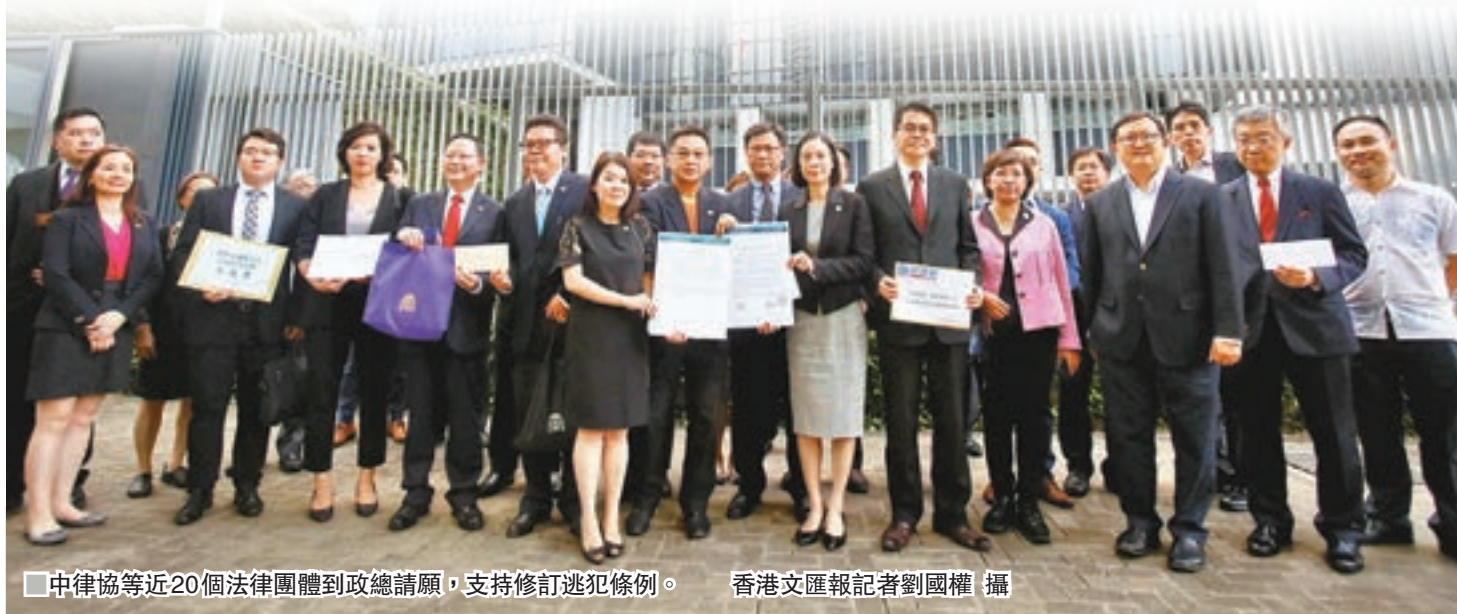
中律協等近20個法律團體到政總請願，支持修訂逃犯條例。

他們強調，法律人應該堅守專業理性，批評一些法律界人士重複同一套偏頗及不全面的說法，聲稱修例是「擺法院上枱」，將法律政治化，把修例變成選舉或政治籌碼。他們冀大家認清國際修例一事去角力的現實，站穩立場維護國家利益，捍衛「一國兩制」及香港的長期繁榮穩定。