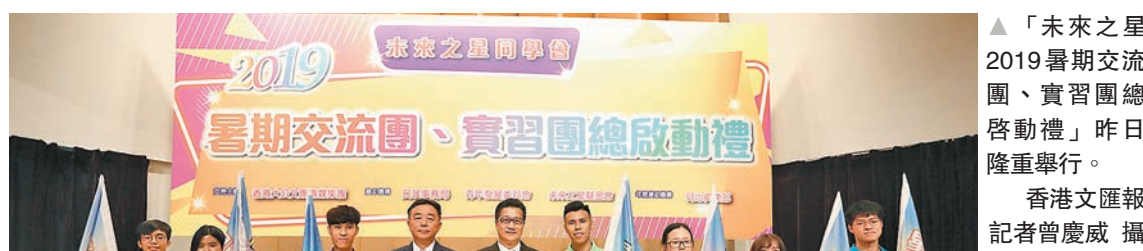
▲「未來之星2019暑期交流團、實習團總啟動禮」昨日隆重舉行。▲大會向即將出發的另外8團的學生代表授予旗幟。

為進一步幫助香港青少年「走出去」拓闊視野，香港大公文匯傳媒集團及未來之星同學會今年暑假共舉辦9個交流團和實習團，帶領近400名香港大專及中學生到內地多個城市以及「一帶一路」沿線國家探索體驗。活動昨日舉行總啟動禮，香港大公文匯傳媒集團董事、未來之星同學會主席姜亞兵期望學生能更深入地了解國情和全球化發展大勢，裝備自己成為建設香港、服務國家的未來之星。特區政府民政事務局副局長陳積志勉勵參加同學把握實習及交流良機，了解國家最新發展及箇中機遇。 ▲香港文匯報記者 姜嘉軒