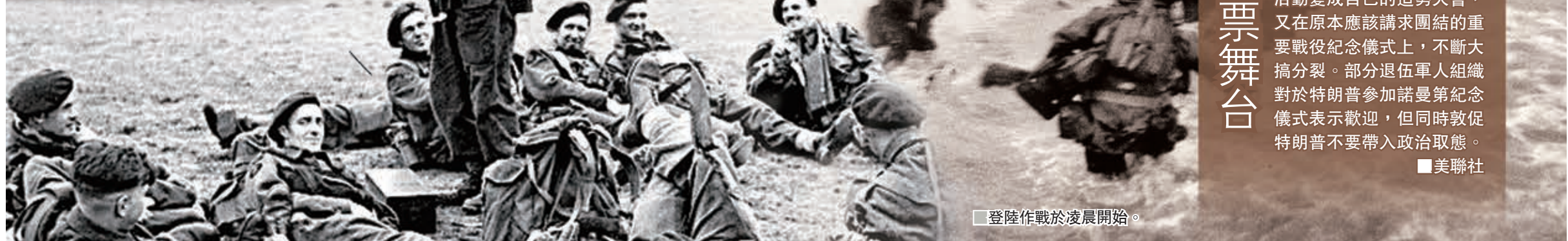
登陸作戰於凌晨開始。

特朗普出席登陸諾曼第75周年紀念活動，不少老兵都擔心身為三軍統帥的他會再次口出狂言，破壞莊嚴的紀念儀式，甚至再次將儀式變成他宣揚個人政治主張和連任拉票的舞台。 越戰5度逃兵役 特朗普在越戰期間，曾經5度以腳踝「生骨刺」為由逃避兵役，但他上台後卻對為國而戰的老兵及陣亡軍人家屬從不客氣，三番五次與家屬罵戰，更將越戰英雄、資深參議員麥凱恩視作眼中釘，即使對方死了也不放過。 特朗普亦從不遵守軍隊不涉政治的慣例，多次將軍方活動變成自己的造勢大會，又在原本應該講求團結的重要戰役紀念儀式上，不斷大搞分裂。部分退伍軍人組織對於特朗普參加諾曼第紀念儀式表示歡迎，但同時敦促特朗普不要帶入政治取態。 美聯社