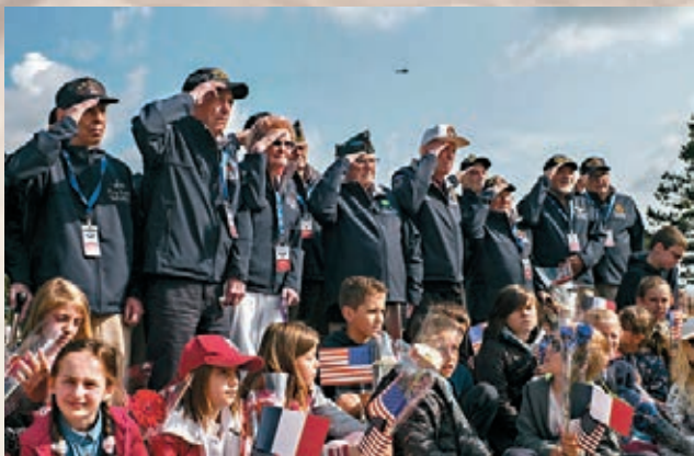
法國前外交官形容，世界已不再一樣，「一日儀式未完結，都要繼續擔心特朗普再在twitter發瘋」。

第二次世界大戰歐洲戰場最大轉捩點的登陸諾曼第戰役(D-Day)，明日迎來75周年紀念，正在英國國事訪問的美國總統特朗普今明兩日將出席在英法兩地舉行的紀念活動。不過在特朗普「美國優先」政策影響下，與5年前的70周年紀念活動相比，美國與歐洲關係大幅惡化，令歐洲各國領導人擔心特朗普可能在此極具象徵意義的活動上，再次發炮批評一眾傳統盟友，進一步破壞西方團結。