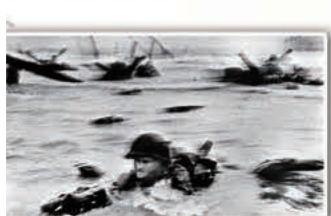
諾曼第登陸死傷慘重。