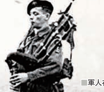
軍人在戰事期間稍稍放鬆。