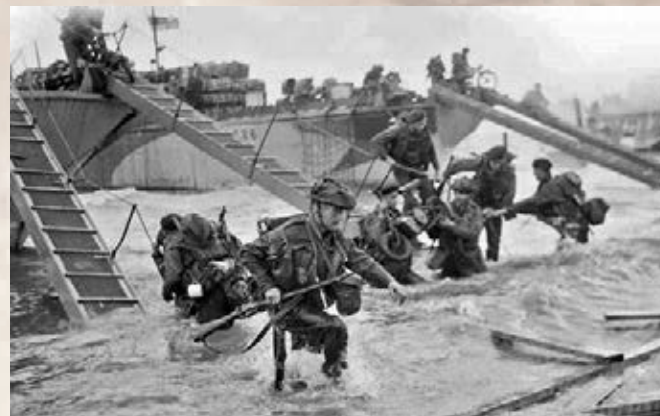
盟軍於1944年6月6日發動「大君主作戰」，15萬士兵分海空兩路登陸法國北部諾曼第地區。網上圖片