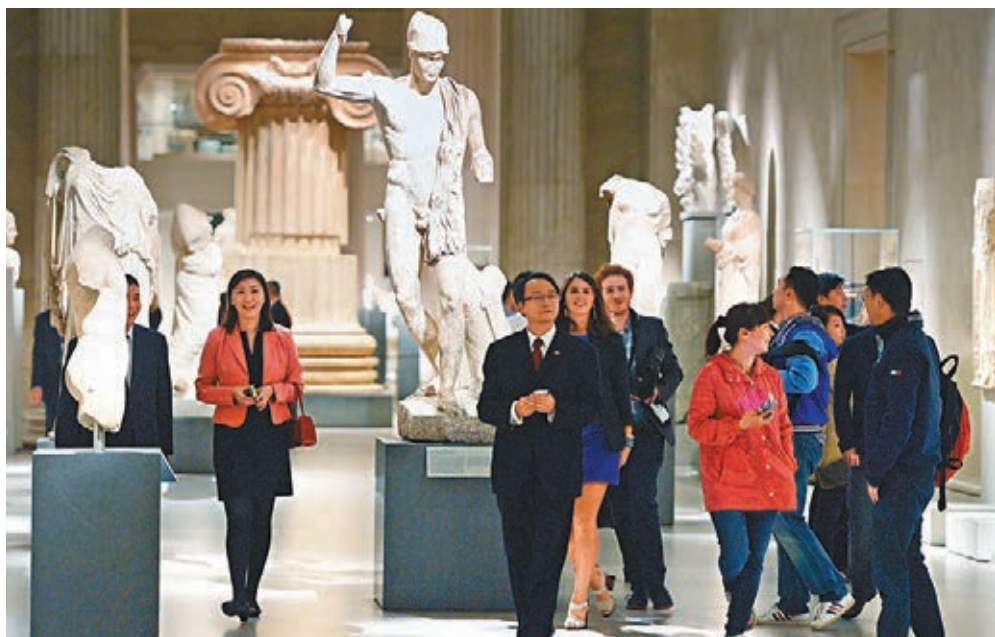
■外交部和文旅部昨日聯合發佈赴美預警。圖為中國遊客在美國紐約大都會藝術博物館參觀。資料圖片

香港文匯報訊(記者 劉凝哲 北京報道)中國外交部、文化和旅遊部昨日下午聯合發佈赴美預警，兩部門稱，近期，美國執法機構多次採取入境盤查、上門約談等多種方式騷擾赴美中國公民，同時近期美國槍擊、搶劫、盜竊案件頻發。中國遊客、中資機構等應提高安全意識，審慎前往。外交部強調，針對中國公民在入境美國時或在美境內被美方執法機構無端盤查騷擾等情況，中方已多次向美方表達關切。「提醒赴美中國公民注意相關安全風險，是完全應該的事情。」3日，中國官方剛剛對赴美留學發出預警。北京國際問題專家向香港文匯報表示，這是中方對美國此前激進做法的回擊，具有很強的政治宣示意味。