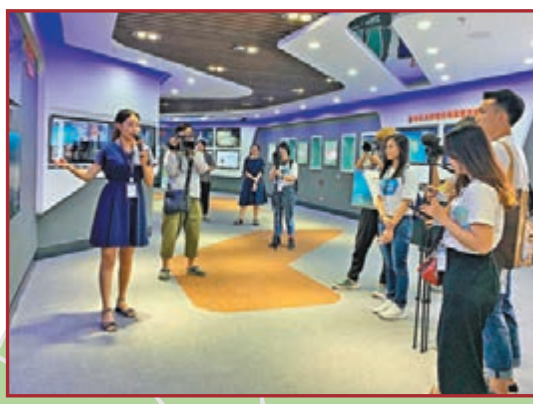
參觀海口高新技術產業開發區、海南省博物館、騎樓老街、海口濕地保護建設、海南野生動物園等。圖為香港傳媒學子走進海口高新技術產業區。

「范長江行動」今年踏入第六年,活動旨在學習和弘揚范長江「記者永遠在路上」的精神,一路行走、體驗、思考和寫作。在過去5年,近400名香港大專院校傳媒學子行走了21條路線,跨越全國106個城市,並到訪馬來西亞、新加坡、俄羅斯等7個「一帶一路」沿線國家。