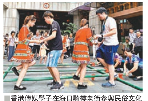
香港傳媒學子在海口騎樓老街參與民俗文化互動。

香港文匯報訊(記者彭晨暉海口報道)「范長江行動」在迎來第六個年頭之際,首次開闢「海南行」線路。在這條今年首發路線中,學子們將從海口市一路向南,參訪文昌市、瓊海市、萬寧市、三亞市等7個地縣的自然生態及文化旅遊區、知名企業。 在此期間,香港學子將通過實地走訪感受海南參與國家發展的脈搏,包括前往文昌遠眺中國文昌航天發射塔,參訪海南航天工程種研發中心、航天超算大數據中心等,了解中國航天事業的發展;走進「外交小鎮」,實地探訪博鰲亞洲論壇永久性會址、潭門漁港、沙美村;參訪海口高新技術產業開發區及三亞國際免稅城等地,感受建設中的自由貿易區與國際旅遊島。 此外,學子們還將參與眾多文化與體驗活動,充分感受當地風土民情:參訪海南省博物館,追尋歷史上興旺發達的「海上絲綢之路」盛況;走進興隆熱帶植物園,觀賞海南獨有的熱帶經濟作物、林木及園藝;探訪保亭檳榔谷,領略黎族文化風情;深入三亞海棠灣水稻國家公園,了解「中國種業硅谷」南繁科研種植基地;抵達地標天涯海角,感受植根人心中的「天涯情節」。