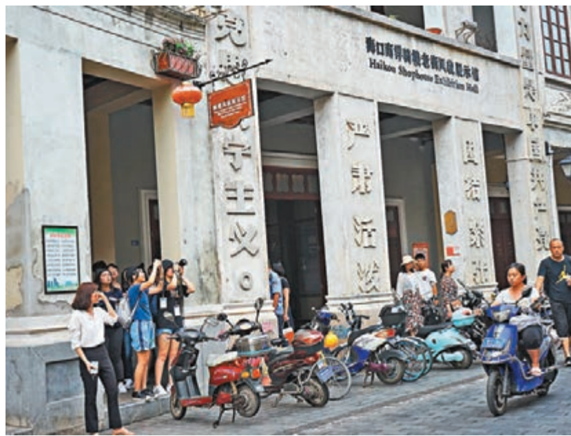
香港傳媒學子遊覽海口騎樓老街。