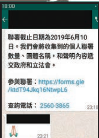
聯署截止日期為2019年6月10日。我們會將收集到的個人聯署數量、團體名稱，和聲明內容遞交政府和立法會。