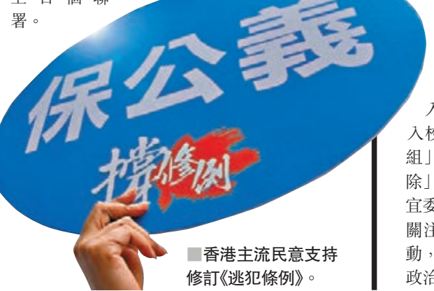
香港主流民意支持修訂《逃犯條例》。

亦有不同細分，如「ACG次文化界」、「IT界」、「運動愛好者」、「動保」、「動漫」、「鍵盤戰士」等等。就連針對「任何人」的聯署都有3個，分別為「白宮聯署」、「全球聯署」、「香港市民聯署」，意味一個人隨意都可以簽出幾十個上百個聯署。