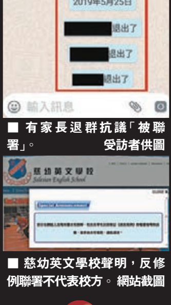
慈幼英文學校聲明，反修例聯署不代表校方。網站截圖