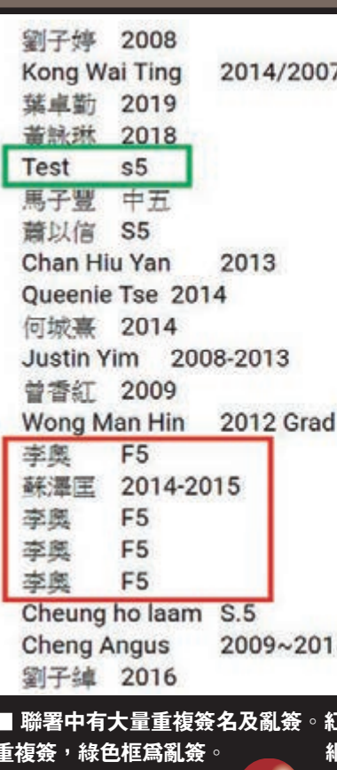
聯署中有大量重複簽名及亂簽。紅色框為重複簽，綠色框為亂簽。