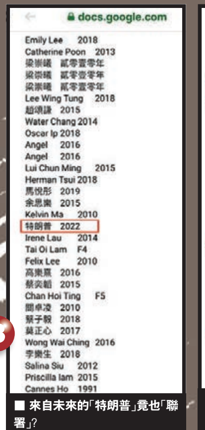
來自未來的「特朗普」竟也「聯署」?