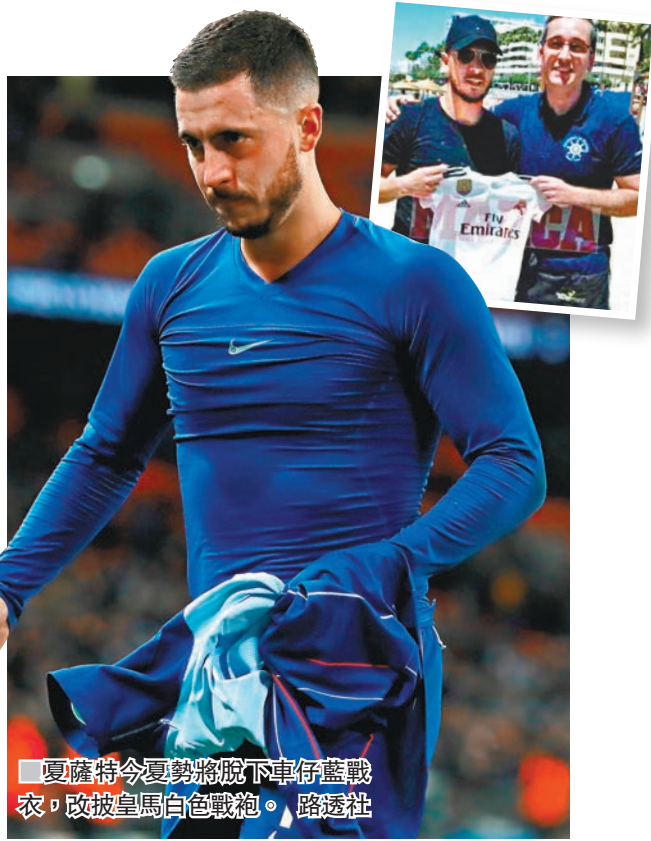
夏薩特今夏勢將脫下車仔藍戰衣，改披皇馬白色戰袍。