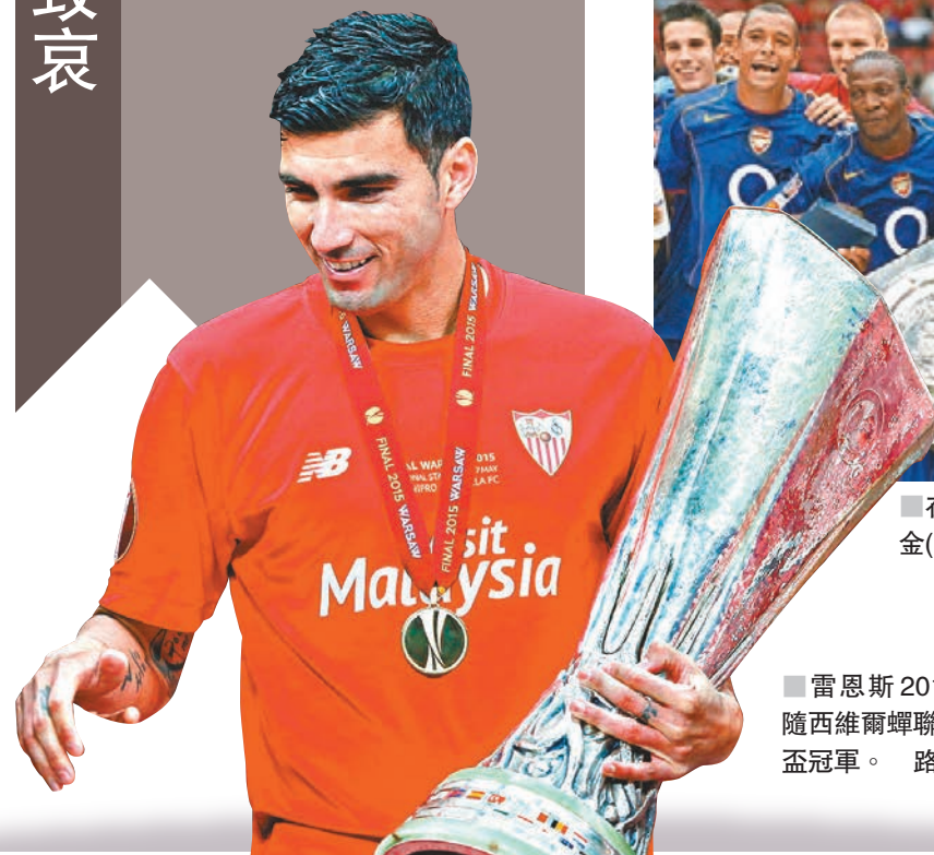
雷恩斯2015年隨西維爾蟬聯歐霸盃冠軍。