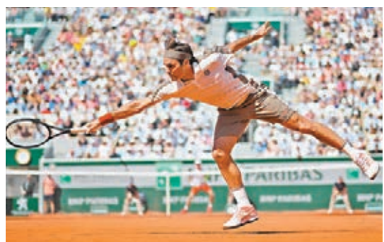
費達拿迎來新里程碑。