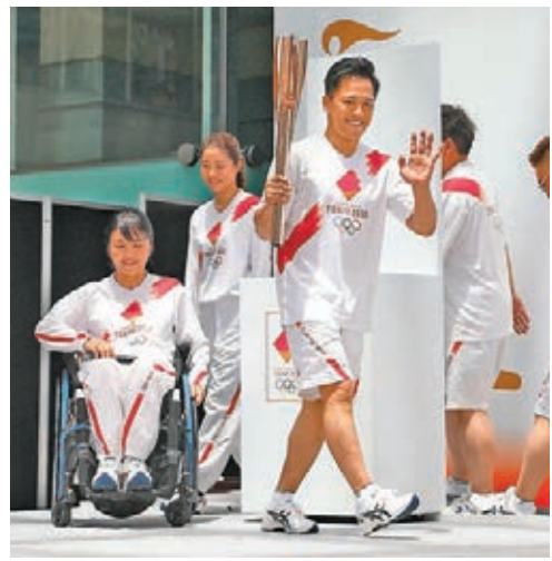
擔任火炬傳遞大使的柔道三金名將野村忠宏(左三)、前殘奧代表田口亞希(左)和女星石原里美等，向媒體展示火炬手服裝。