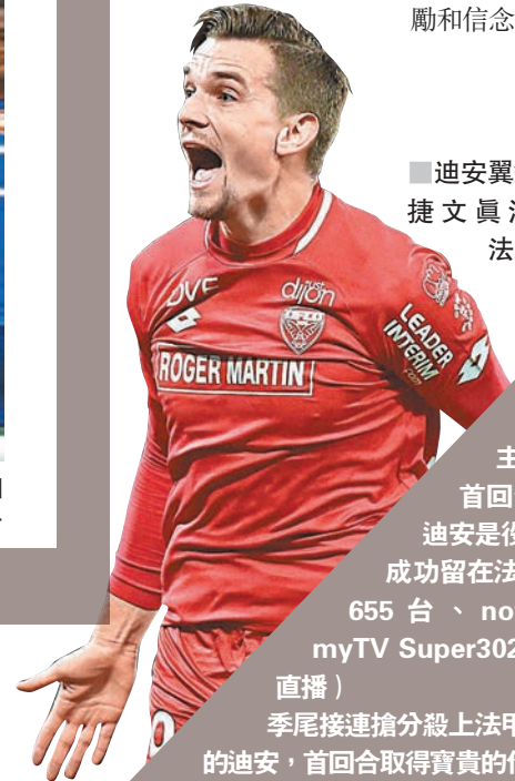
迪安翼鋒班 捷文真洛。