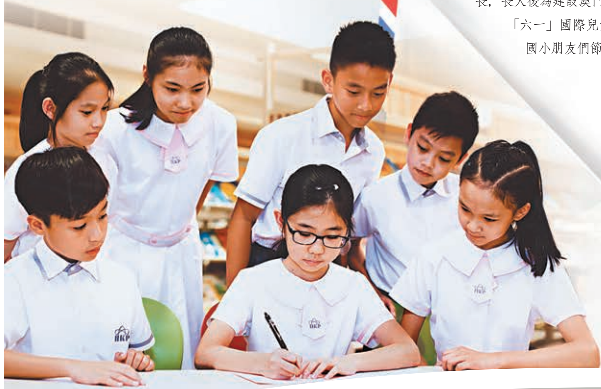
■澳門濠江中學附屬英才學校的小學生在寫信。