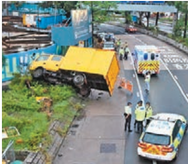
「炒車彎」昨日再發生交通意外。

香港文匯報訊（記者 蕭景源）長沙灣葵涌道近荔枝角道交界「炒車彎」，昨日發生6日來「第五炒」。一輛貨車清晨5時許在天雨路滑下，沿荔枝角道駛經彎位，與一輛私家車相撞後，失控剷上花槽後傾側。姓盧貨車司機、姓方私家車司機及貨車上一名跟車工人輕傷。這是現場自上一來第五宗「翻版」車禍。