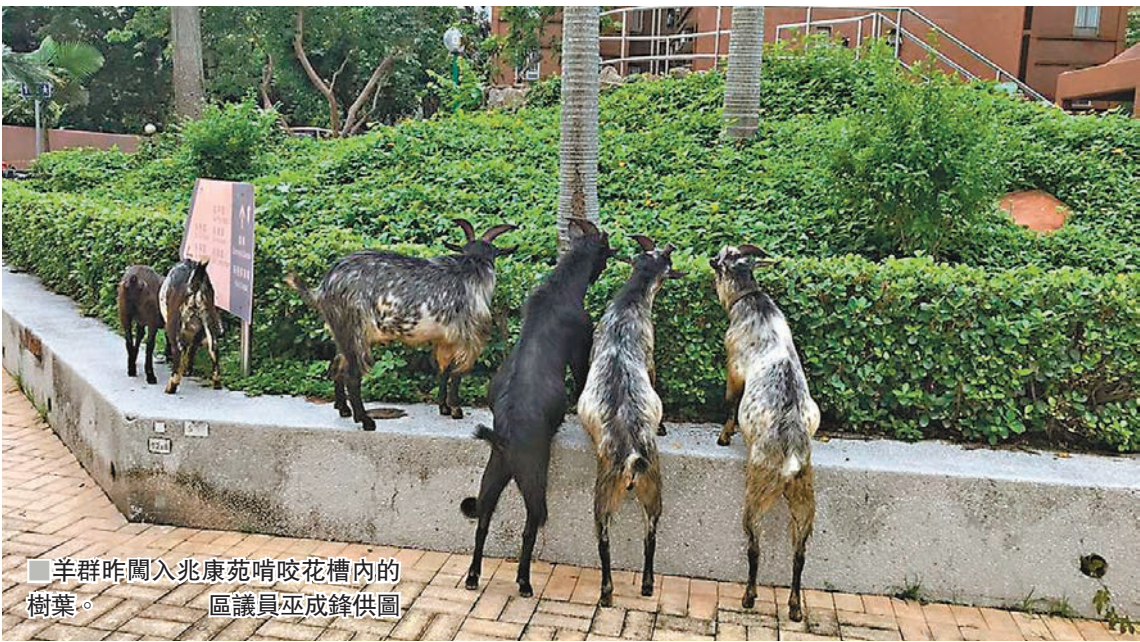
羊群昨闖入兆康苑啃咬花槽內的樹葉。

他昨到羊欄視察時發現兩隻公羊正在棚內激烈互撞比鬥，擔心公羊一旦受刺激會攻擊市民，將會跟進羊群影響居民問題，包括尋找羊主商討加固羊棚防止羊隻走失，以及向漁護署諮詢有關管理羊群方法，再將方法轉達給羊主。