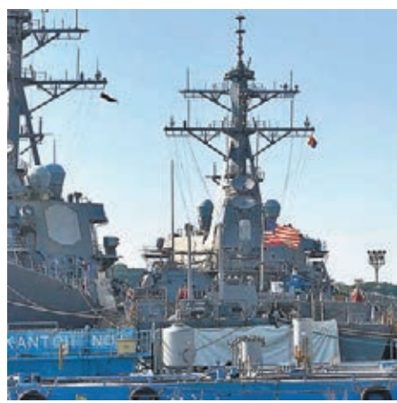
「麥凱恩」號船名被遮蓋。網上圖片

美國總統特朗普早前訪問日本期間，曾視察橫濱的駐日美軍基地，並登上「黃蜂」號兩棲攻擊艦，向軍人發表講話。《華爾街日報》前日引述美軍司令部一名官員的內部電郵，內容包括下令海軍官員在特朗普視察期間，駐紮基地內的驅逐艦「麥凱恩」號，不可在特朗普視線範圍出現。特朗普前日在twitter回應，表示對事件全不知情。