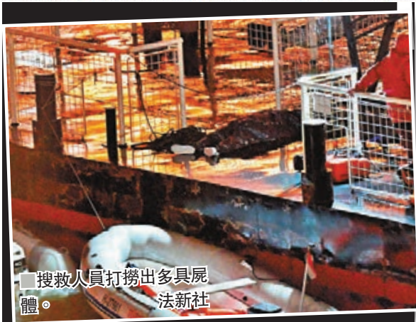
搜救人員撈出多具屍體。