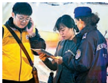
韓國使館職員確認死者身份。

多瑙河貫穿歐洲多國，不少旅客到中歐和東歐旅遊時，均會乘坐觀光船飽覽河畔風光，夜遊多瑙河更幾乎是遊覽布達佩斯不會錯過的行程。然而多名曾在布達佩斯遊船河的韓國旅客透露，當地觀光船安全設備長期不足，船上不設救生艇，亦未有向乘客提供救生衣，乘客安全成疑，不過有旅遊業從業員稱，觀光船其實有救生衣，只是乘客大多不願穿上。