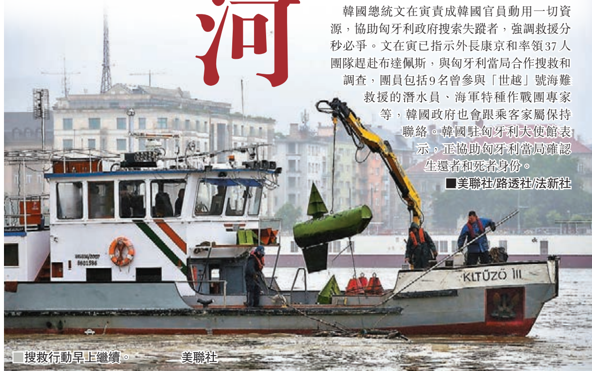
搜救行動早上繼續。