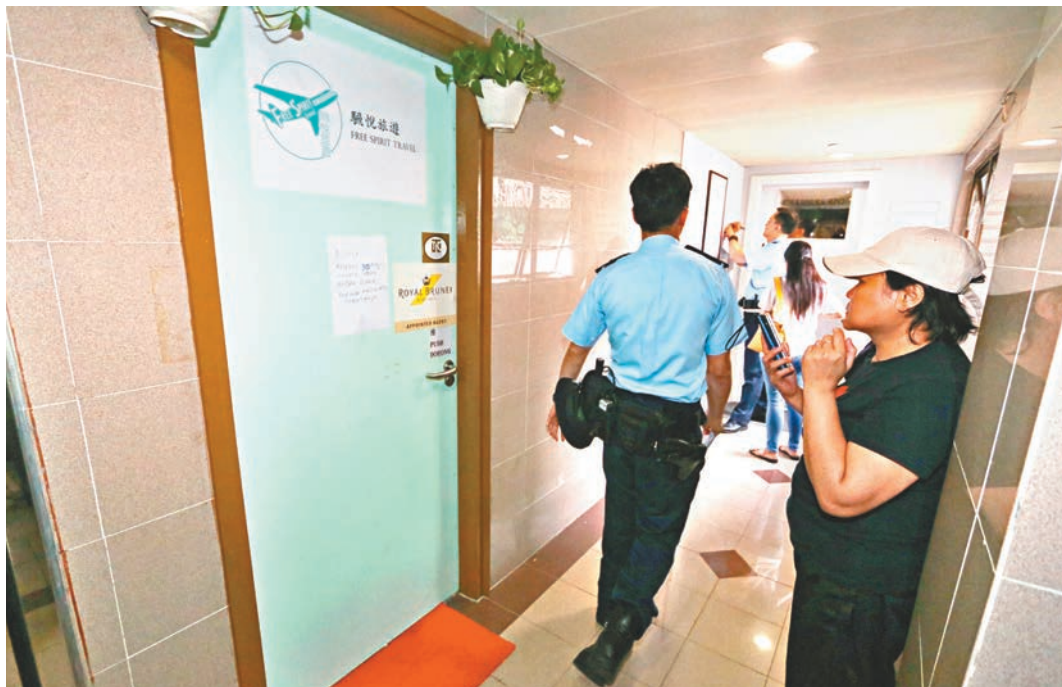
驕悅旅遊突然結業重門深鎖,警員接獲苦主報案到場調查。

香港文匯報訊(記者 劉友光、蕭景源)專門代辦往來香港與印尼機票的「驕悅旅遊」,疑陷入財困,前日突然宣佈結業,受影響旅客估計多達460人,涉款共約120萬元。由於下月6日是印尼新年,大批已訂機票準備回鄉過節的印尼傭工受影響,部分人昨晨到機場始知無法登機,往旅行社的銅鑼灣辦公室追討時,發現已人去樓空,無奈報警求助,警方已列作「求警調查」處理,暫時無人被捕。旅行社代理商註冊處指已吊銷「驕悅旅遊」的牌照,並將個案轉介執法機關跟進,海關至今共接獲兩宗舉報。