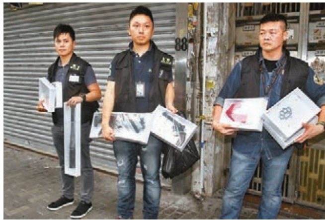
警方檢走包括仿製槍、鐵蓮花、利刀及墨球棍等武器。

另又搜獲一批吸毒及包裝工具,並檢獲兩支仿製槍械、兩個鐵蓮花、兩把利刀、1支墨球棍等武器。