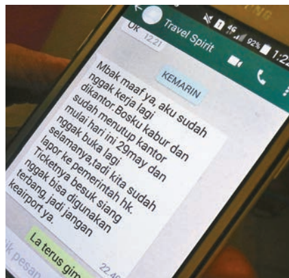
苦主展示前晚接獲驕悅旅遊職員的WhatsApp通知,指老闆失蹤,旅行社已倒閉。