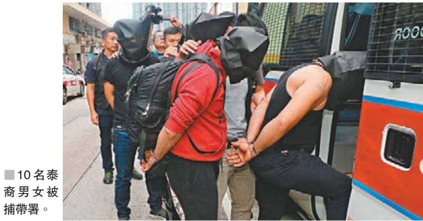
10名泰裔男女被捕帶署。

香港文匯報訊(記者 蕭景源)疑有黑社會背景的泰裔成員,在九龍城暗設毒品飯堂及武器庫,重案組探員根據線報追查後,昨晨採取行動,突擊搜查一個目標,當場拘捕10名泰裔男女,檢獲一批毒品、吸食工具,以及兩支仿製槍械等攻擊性武器。