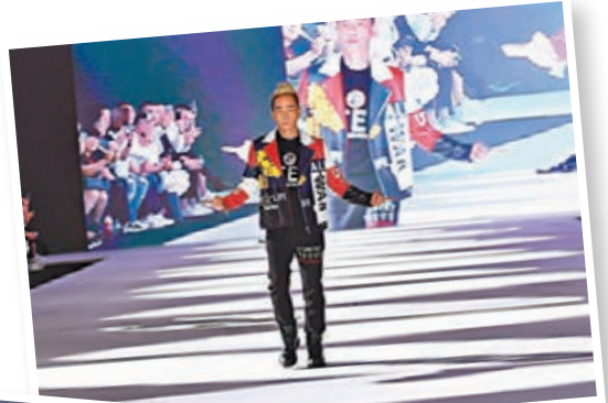
陳小春為時裝騷壓軸出場。