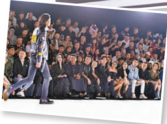
梁家輝夫婦、曾志偉、鍾鎮濤夫婦、葉童夫婦等坐在台下欣賞時裝騷。