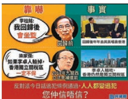
民建聯回帶反對派謠言。民建聯fb圖片