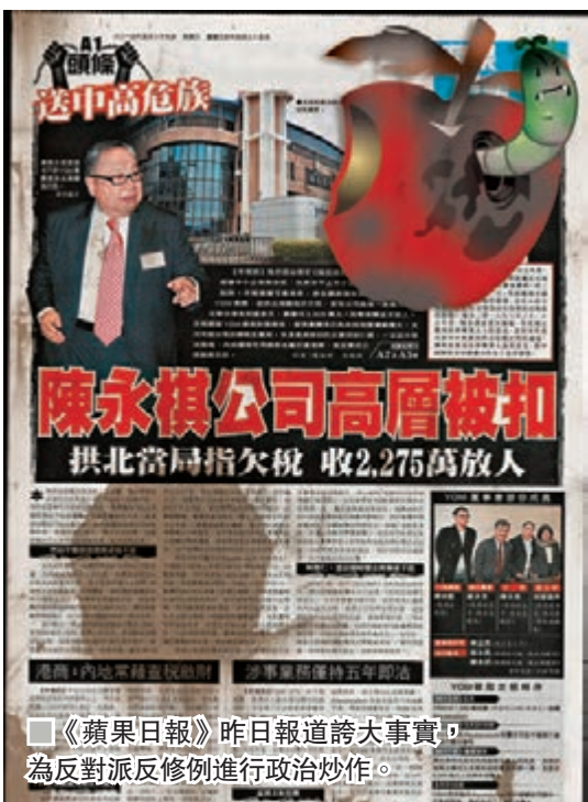
《蘋果日報》昨日報道誇大事實,為反對派反修例進行政治炒作。