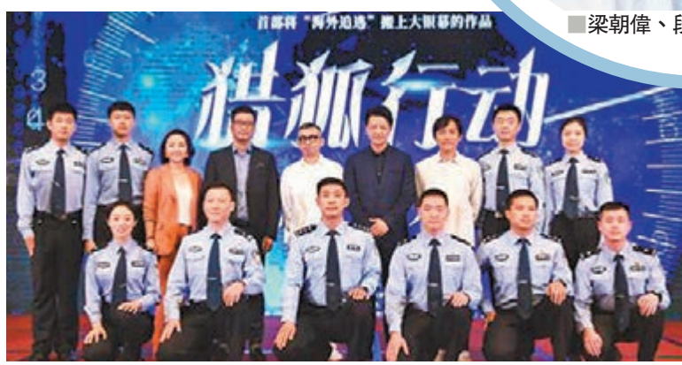
《獵狐行動》在北京舉辦開機發佈會，導演、編劇張立嘉，演員梁朝偉、段奕宏等出席活動。

值得一提的是，此次是梁朝偉和段奕宏首次合作，兩人也十分有默契，不僅互相誇讚對方作品，段奕宏更現場化身「迷弟」，「這種場合我還是把持一下作為粉絲的心情。不僅僅是對心目中真正意義上的演員的崇敬和欽佩，梁先生有很多經典之作，他讓我們這些追求表演、追求創作的演員和後輩們仰慕，同時也給我們很大的動力，去學習如何做真正意義上的演員。非常榮幸能跟梁先生這次有合作的機會，同時也提醒我自己懷揣這份粉絲的心情，讓我們一起打造出一部完美的《獵狐行動》」。