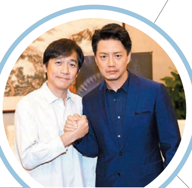
梁朝偉、段奕宏強強聯手。