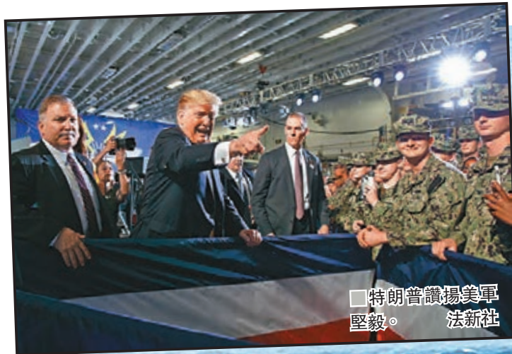
特朗普讚揚美軍堅毅。

美國總統特朗普訪問日本行程昨日踏入最後一天，特朗普在日本首相安倍晉三陪同下前往橫須賀海軍基地，視察日本海上自衛隊的「加賀」號護衛艦及駐日美軍「黃蜂」號兩棲攻擊艦，是美國總統首次登上自衛隊護衛艦。特朗普發表演說時稱，美國在太平洋地區具備重大威懾力，而自衛隊在升級軍備後，可協助美國及盟友應對區內外的威脅，期待自衛隊給予美軍支援。