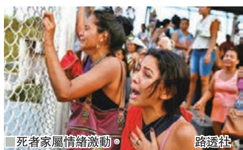
死者家屬情緒激動。

巴西北部4間監獄近日發生敵對幫派衝突，引發暴亂，最少40名囚犯死亡，事件再令外界關注巴西監獄暴力頻繁及管理不善問題。