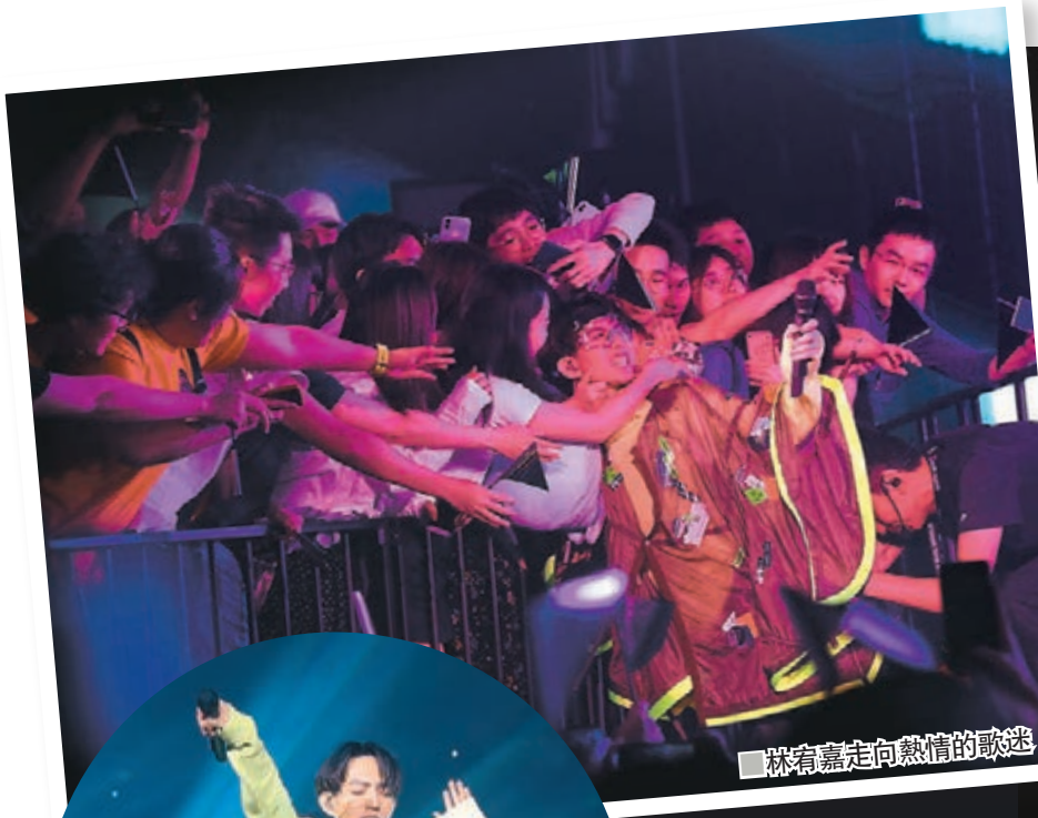
林宥嘉走向熱情的歌迷。