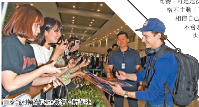
泰舒利頓為 Fans 簽名。