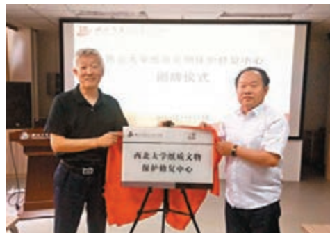
■西北大學紙質文物保護修復中心正式揭牌。