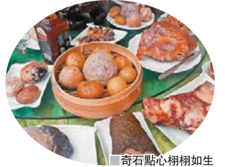
奇石點心栩栩如生

一半像一個砂鍋，但裡面又是半空心，內部全部都是金黃色的瑪瑙晶體，就像煮了一鍋山珍海味。還有「烤羊腿」不但形狀具象，質感也很真實，滿身燒烤的油黃讓人看着能感覺到的香氣。