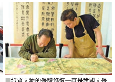
■紙質文物的保護修復一直是我國文保領域的一個短板。