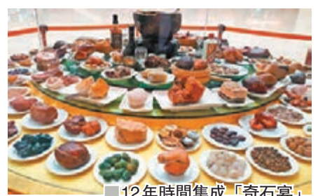
■12年時間集成「奇石宴」

這桌「奇石宴」參照清代的滿漢全席來配置，一共有120多道菜。其中的佛跳牆、烤羊腿、北京烤鴨都是非常具象。特別是「佛跳牆」由一個40公分直徑的瑪瑙球從中間天然斷開，留下的這