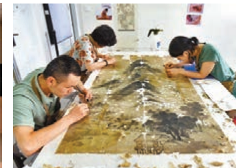
■工作人員正在修復古畫。