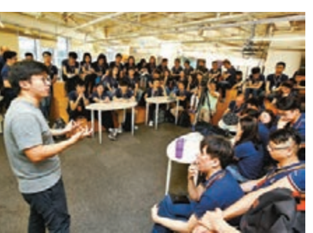
港生參觀由港青在北京創立的科技公司「錢方好近」。

在對談中,呂博勉勵港生指,創業需要更有「直接的切入點,從內心出發」,做到更便捷、更快速、更便宜,在「多快好