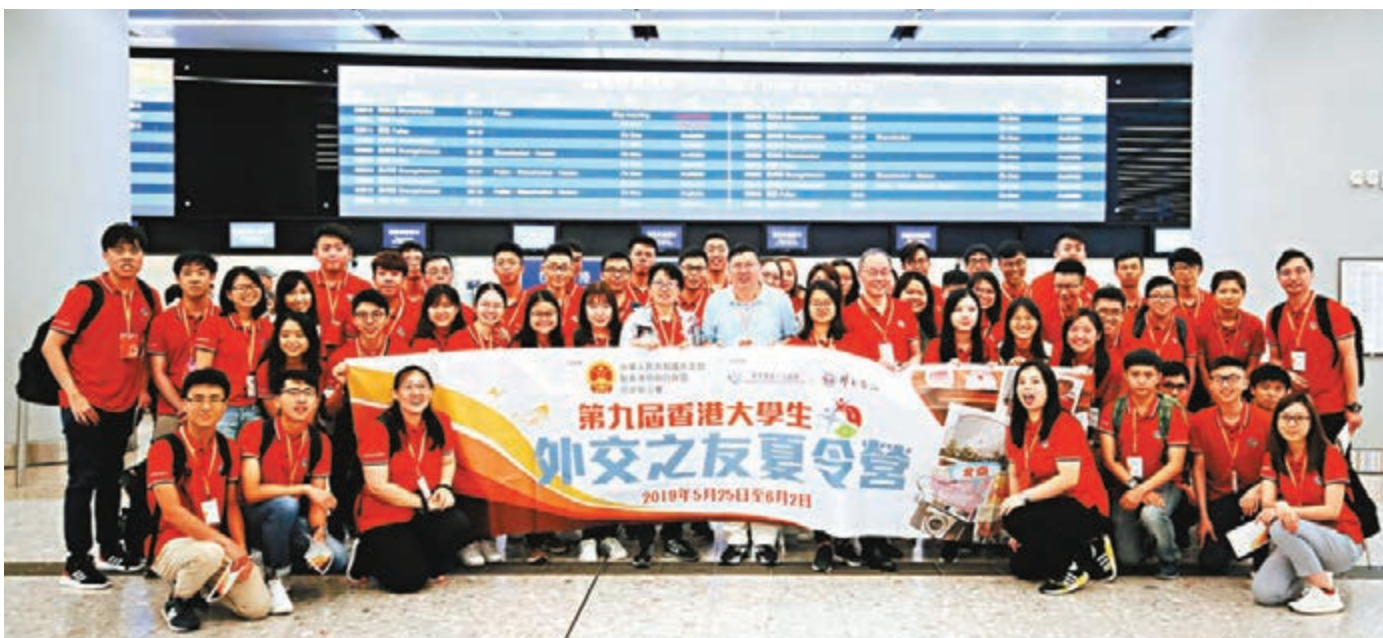
50名香港大學生乘高鐵前往北京開展今年的「外交之友夏令營」。

此外,他亦非常期待越南行程,指越南是中國「一帶一路」倡議的重要戰略夥伴,特別希望看見中越兩地的合作。