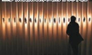
■參觀者觀看展出的非洲木梳。

早前，第64屆布魯塞爾古董藝術博覽會在比利時首都布魯塞爾開幕，來自世界各地的133家畫廊攜上萬件藝術品參展，吸引不少參觀者觀看藝術展品。布魯塞爾古董藝術博覽會始創於1956年，是歷史上歷史悠久、享有盛譽的藝術博覽會之一。