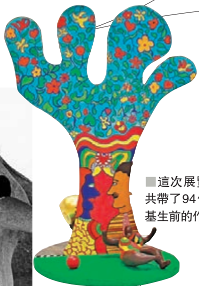
■這次展覽一共帶了94件妮基生前的作品