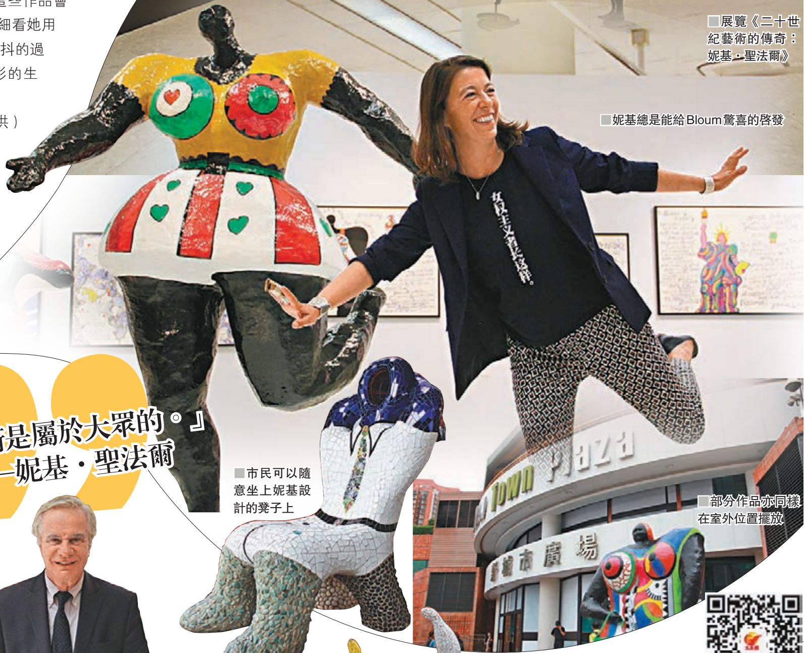
■展覽《二十世紀藝術的傳奇：妮基·聖法爾》

妮基的作品大部分都呈現鮮艷的顏色，我們或許會感到很親切或者熟悉，因為 Bloum 認為她的作品與現代女性的思想更為貼近。但是 Bloum 提到在妮基的時代，那些顏色往往被視為好勝、且具有侵略性，品味極低。「她的雕塑都是肥胖的女性形象，形容都極不討好。那是很有趣的，因為我們能看見時間改變了看事物的角度，我們對事物的解讀都會隨著時間而改變。但是我認為妮基的作品沒有時間、地域的界限，因為不同背景的女性會在不同時期受到她的作品所影響。」Bloum 覺得因為妮基是一個充滿愛的人，所以她的作品裡也體現到一種包容和慷慨。