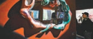
■參觀者觀看藝術展品

「保持對事物好奇心，你就永遠活着。哪一天你不再 有疑問了，就和死去再沒區別。」——妮基·聖法爾