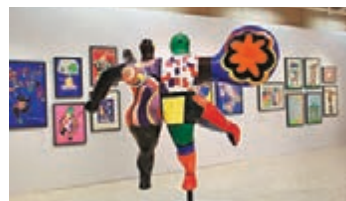
《溜冰者（長翅膀的情侶）》是一對「連體」情侶，共有三隻腿和一隻翅膀，翅膀意味著一隻「鳥」的自由，不被愛情約束。