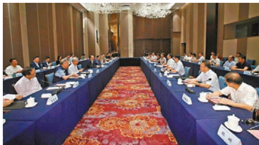
港區全國人大代表專題調研組赴海南，與海南省委常委彭金輝、海南省人大常委會副主任林北川等會面。

香港文匯報訊(記者 文軒)港區全國人大代表專題調研組昨日抵達海南，展開一連5天的調研活動，將先後在海、三亞等多個城市，就當地的醫療、旅遊、文化及自貿區建設等方面進行調研。