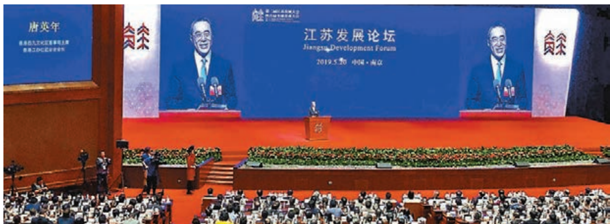
唐英年在會上發表演講。

香港文匯報訊(記者 子京)「第二屆江蘇發展大會暨全球首屆蘇商大會」日前於南京舉行，大會由江蘇省委書記婁勤儉及省長吳政隆主持，全國政協常委、香港江蘇社團總會會長唐英年出席並發表演講，各界江蘇籍僑胞約1,200人參與活動。