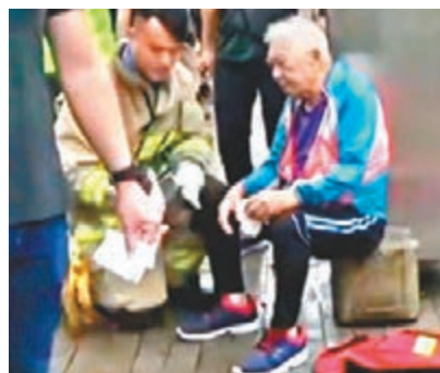
■85歲男死者送院前仍清醒。

香港文匯報訊(記者蕭景源)觀塘道牛頭角下邨對開發生奪命車禍。一輛私家車疑路滑失控撞巴士站，4名候車者及時走避，但仍被碎片濺傷，