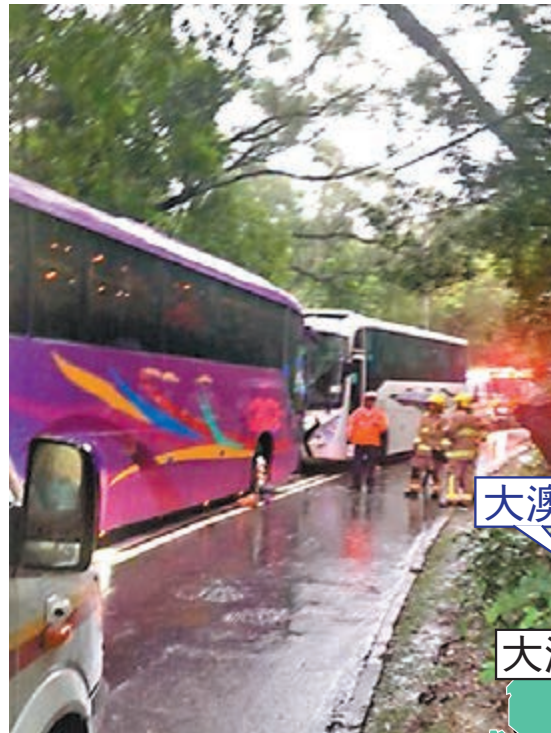
■白色車身的新大嶼山巴士越線迎撞旅遊巴。網上圖片