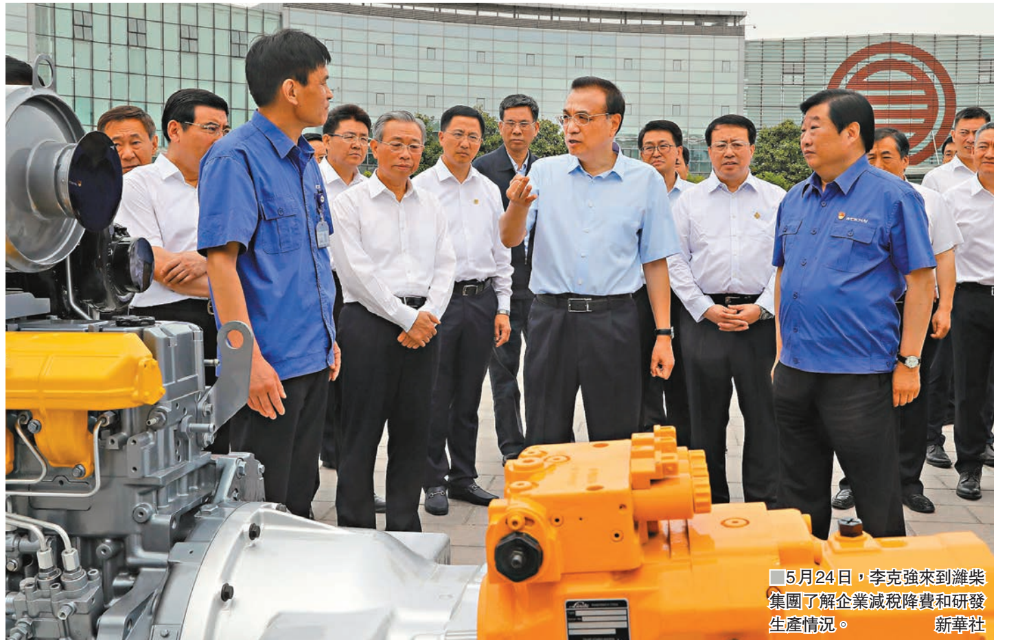
5月24日，李克強來到濰柴集團了解企業減稅降費和研發生產情況。

的地方和部門負責同志說，現在市場供求總體平衡，要關注部分關係群眾日常生活的產品價格變動情況，採取適當措施，保障供應充裕、價格合理。