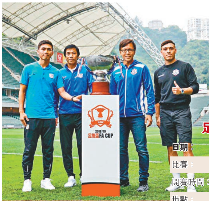
■傑志與南區對冠軍獎盃求之若渴。