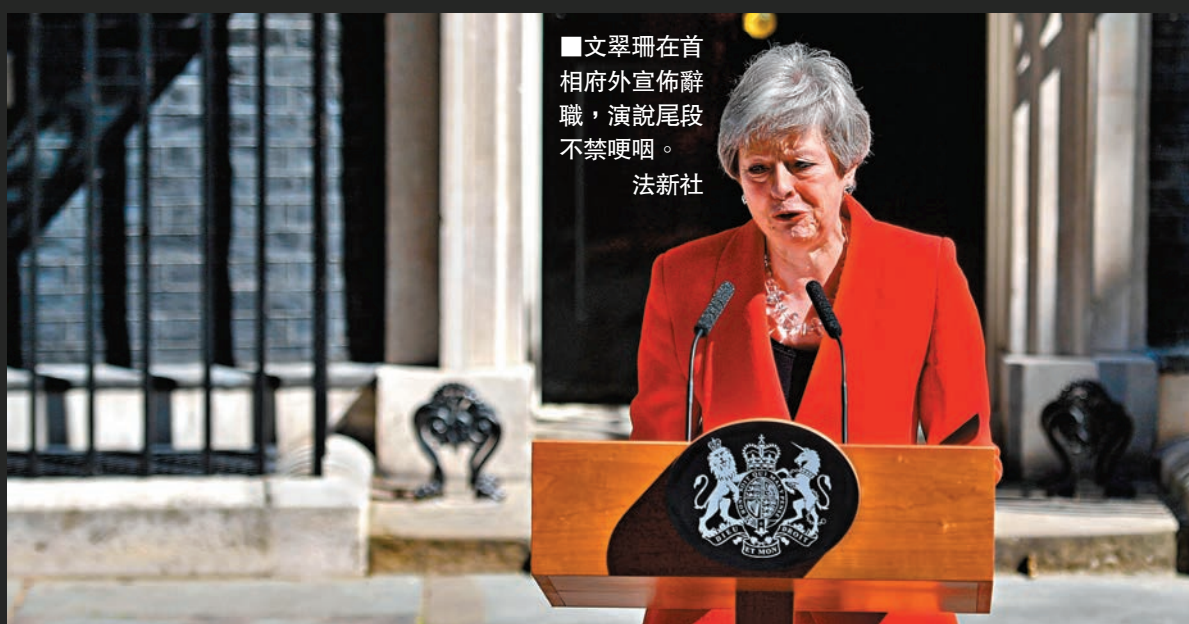
■文翠珊在首相府外宣佈辭職，演說尾段不禁哽咽。

曾經豪言能夠帶領國家脫離歐盟的英國首相文翠珊，在脫歐爭議這場泥漿摔角中打滾3年後，最終決定投降，於昨日含淚宣佈下台。上台時接過脫歐這個爛攤子，下台時爛攤子依然很爛，甚至更爛，文翠珊直言無法實現脫歐是一生遺憾，但認為是時候讓新首相接手，她又引用前人名言，寄語各方必須妥協才能達成共識，「妥協並不是骯髒字眼，人生從來充滿妥協。」文翠珊將於6月7日正式卸任保守黨黨魁，之後留任首相直至保守黨於7月20日前選出新黨魁。