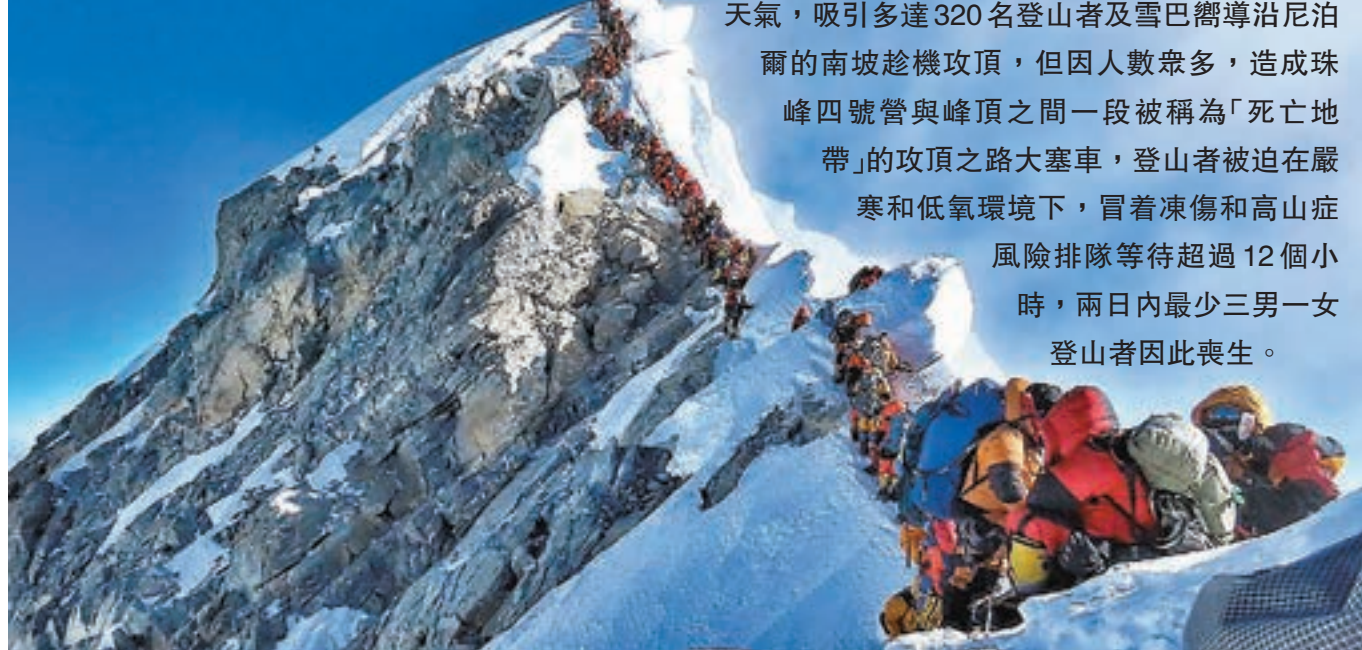
登山者拍下「珠峰長龍」

世界第一高峰珠穆朗瑪峰在周三迎來罕見好天氣，吸引多達320名登山者及雪巴嚮導沿尼泊爾的南坡趁機攻頂，但因人數眾多，造成珠峰四號營與峰頂之間一段被稱為「死亡地帶」的攻頂之路大塞車，登山者被迫在嚴寒和低氧環境下，冒着凍傷和高山症風險排隊等待超過12個小時，兩日內最少三男一女登山者因此喪生。