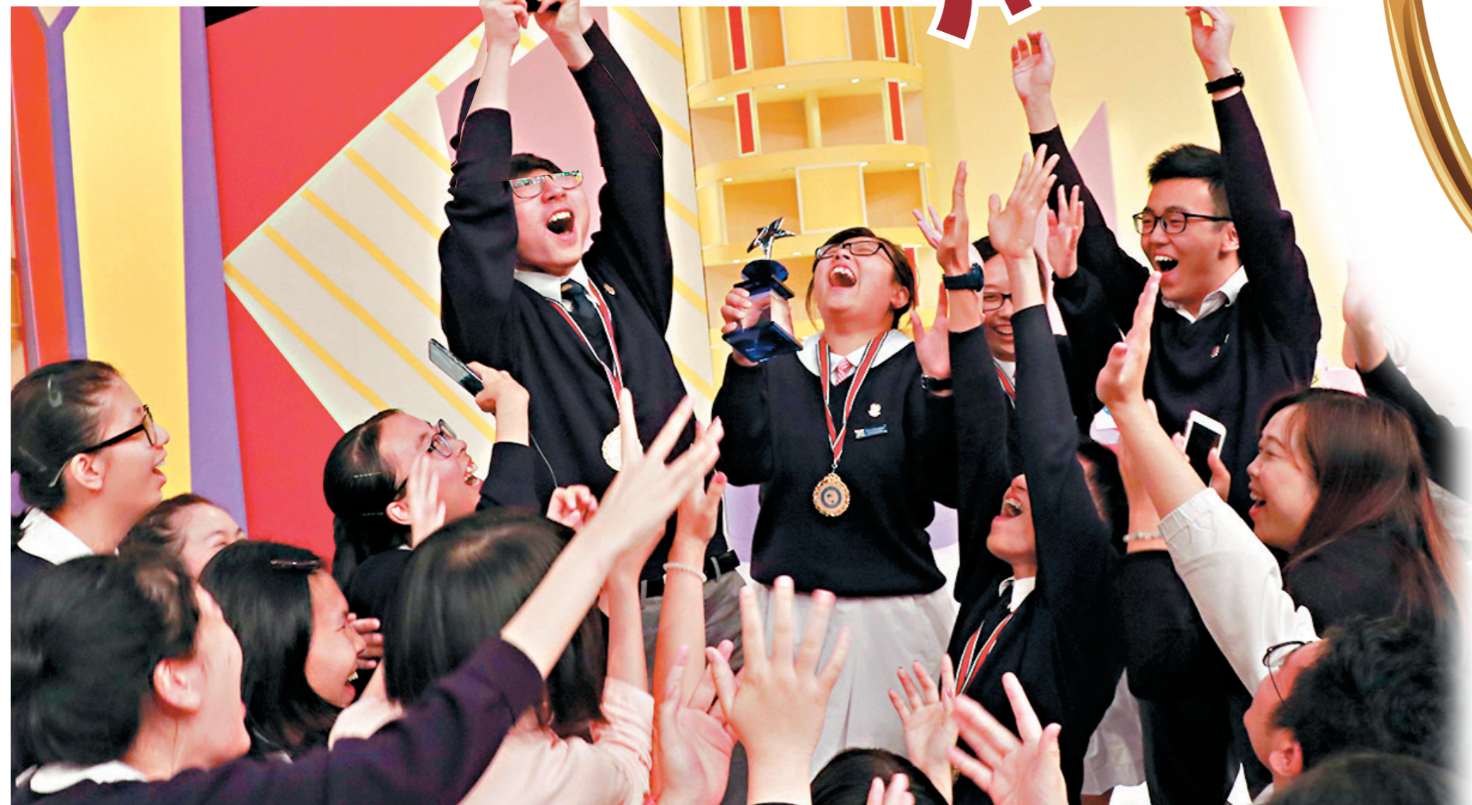
保良局董玉娣中學獲得精英賽金獎。