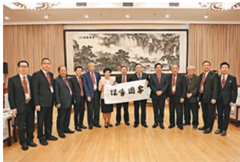
全國政協港澳台僑委員會副主任耿惠昌(右六)接受訪問團致送的墨寶。