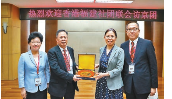
全國青聯主席汪鴻雁(右二)接受吳煥炎(左一)為他們的成長成才,左一為邢善萍、右一為施榮忻。

對此,汪鴻雁勉勵閩籍青年要重視關心香港青年的健康成長,為他們的成長成才創造條件,以鄉情為紐帶,推動香港青年熱愛祖國和民族。