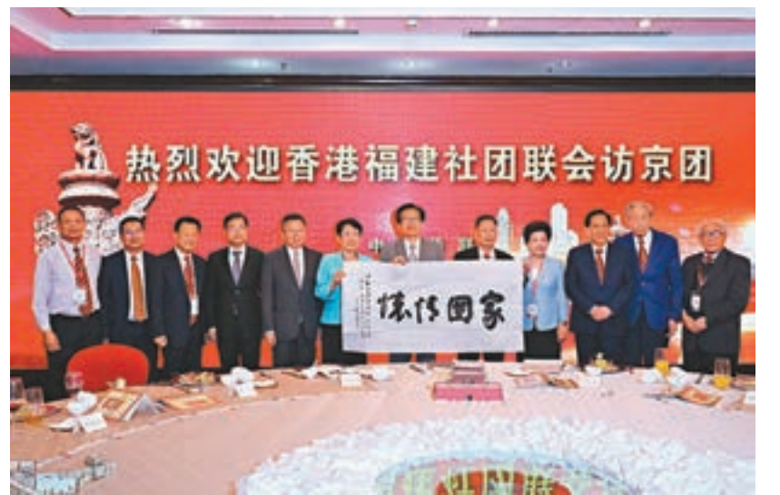
中國僑聯副主席李卓彬(右六)接受吳煥炎等人致送的墨寶。