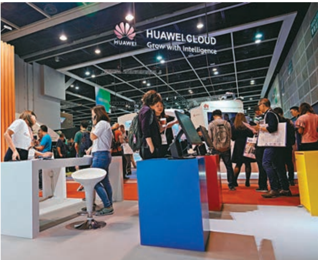
■儘管美國禁止美企向華為出售相關技術和產品，但多家供貨商仍表示會繼續向華為供貨。圖為香港亞太雲端科技博覽會中的華為雲展台。