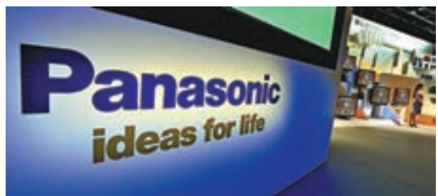
■松下集團發表聲明稱，目前松下集團向華為公司供貨正常。資料圖片

高峰表示，中國政府將繼續加大力度深化改革、擴大開放，為企業營造更加穩定、公平、便利、可預期的營商環境，幫助企業在市場競爭中提高應對風險的能力，在國際化的過程中不斷提升自身的同時，為各國消費者提供更加優質、可靠、多樣化的產品。中國政府有信心、有能力保護中國企業的合法權益。