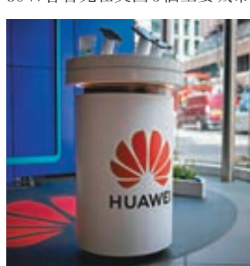
■EE表示將繼續在其部分5G網絡基礎設施中採用華為的設備。圖為該公司商店的華為產品展示台。資料圖片

香港文匯報訊 據新華社報道，英國主要電信運營商之一 Everything Everywhere 公司（EE）當地時間22日宣佈，5月30日會首先在英國6個主要城市