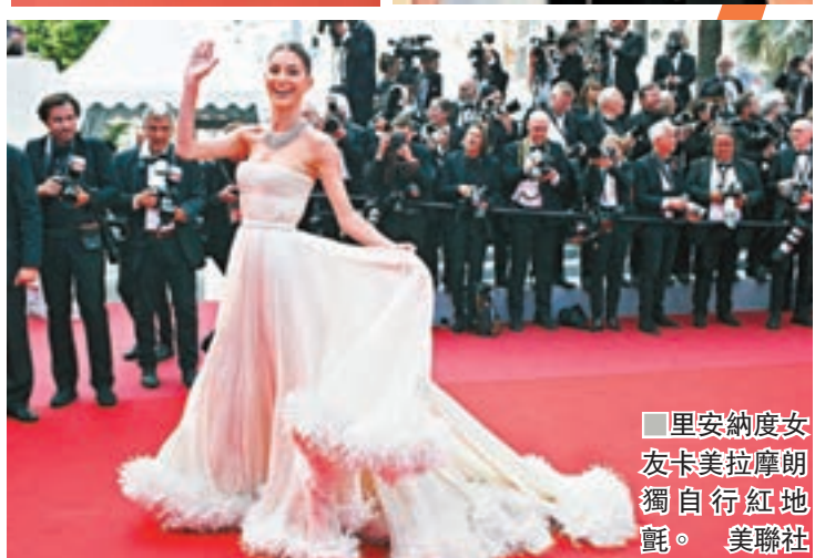
里安納度女友卡馬拉摩朗獨自行紅地氈。