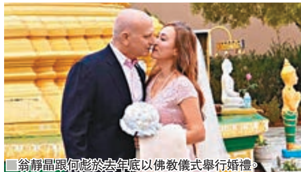
翁靜晶跟何東於去年底以佛教儀式舉行婚禮。