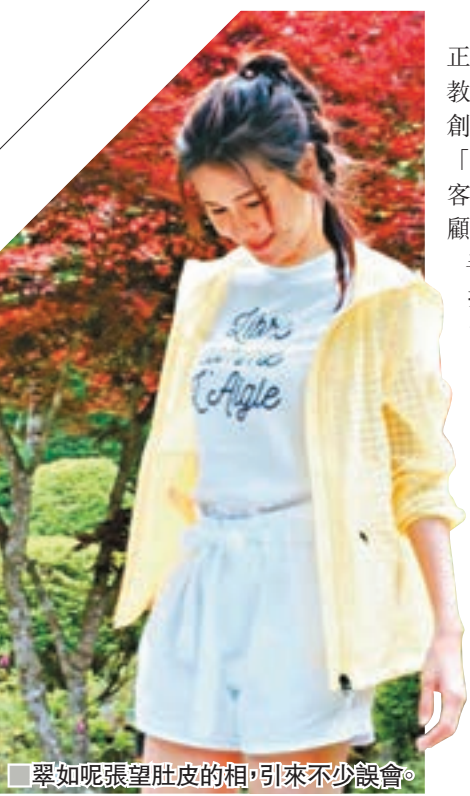
翠如呢張望肚皮的相,引來不少誤會。