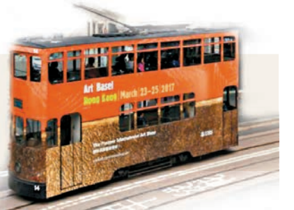
■香港巴塞爾現場裝置作品。

每年春季，香港的藝術氣氛總是特別熾熱。大型藝博會、各項拍賣會的舉行，使香港成為藝術重鎮。雖然來到五月，各項活動落下帷幕，但就藝術交易市場而言，仍有不少可探討的話題。在第八屆巴塞爾藝術展香港展會 (Art Basel HK) (下稱巴塞爾) 舉辦期間，香港文匯報記者走訪參展畫廊、藝術家、藝博會負責人，並以「巴塞爾」為原點出發，作出四期專題系列，當中圍繞「不同地區藝廊在國際交易舞台生存之境」、「台灣畫廊」、「藝術市場性別天平」、「亞洲青年藝術家崛起」四個主題，去發掘藝博會背後的隱形資訊。