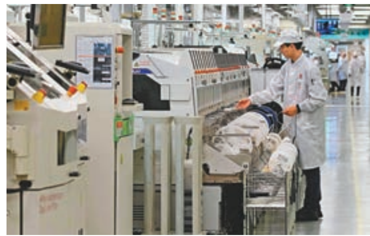
德國專家表示，美國的做法會對全球IT產業造成衝擊。圖為華為在東莞的手機生產線。

克萊因漢斯特別提醒稱，美國政府的做法將衝擊到全球IT產業，而具體的影響程度取決於白宮願意放寬禁令至何種程度。「我們必須注意到，華為是提供電信基礎設施的廠商，同時也需要美國的科技。這意味着，美國政府的決策，將影響到全球，整個5G領域的後續發展都會受到傷害，連帶損傷將會十分巨大。」