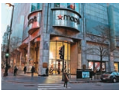
應對關稅上調，美國零售商銷售放緩。圖為美國梅西百貨。

香港文匯報訊 據《華爾街日報》報道，在零售業準備應對美國上調中國進口商品關稅的影響之際，幾家大型