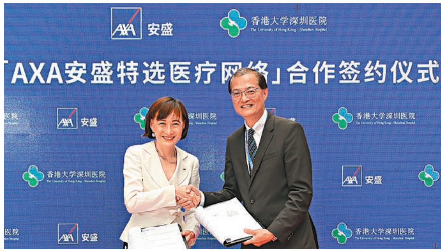
香港大學深圳醫院加盟「AXA安盛特選醫療網絡」。

以往客戶在內地求診需先自行付費或只獲免按金,甚至需帶備預先批核的文件,費時費事。今後,「特選醫療網