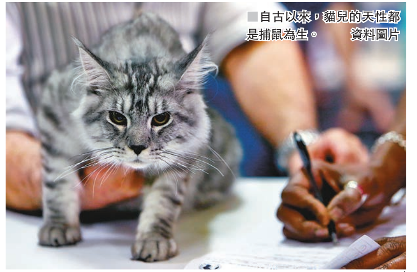
自古以來，貓兒的天性都是捕鼠為生。

已故國家領導人鄧小平有著名的黑白貓論，其實早在蒲松齡筆下也有類似的說法。在其作品《秀才驅怪》中有這樣的一段論述：「異史氏曰：『黃狸黑狸，得鼠者雄。』」不正是和鄧小平的黑白貓論有異曲同工之妙嗎？貓兒活潑可愛，甚得人類歡心，出現在文學作品中更讓人倍感親切和有趣呢。