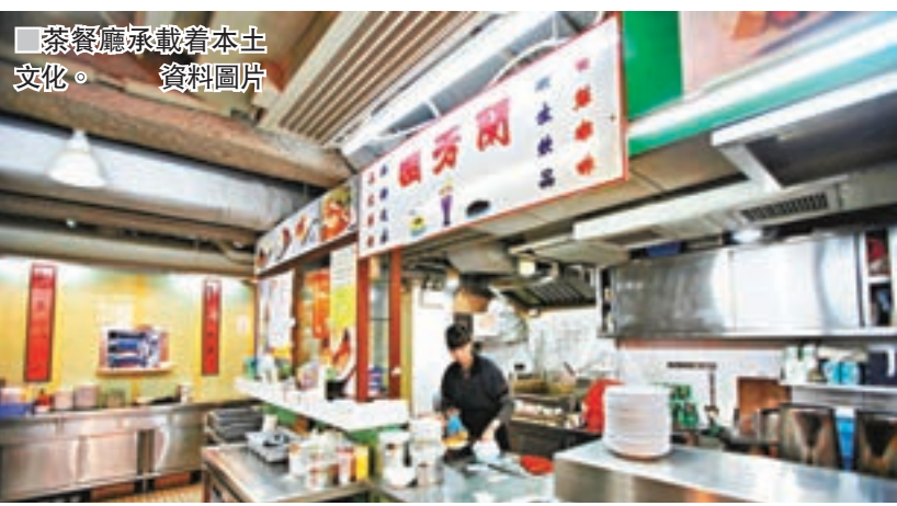
茶餐廳承載着本土文化。

·靚仔 即白飯。由於白飯雪白乾淨，沒有添加顏色，看起來就像清爽秀氣的男孩子，故此被叫做「靚仔」。