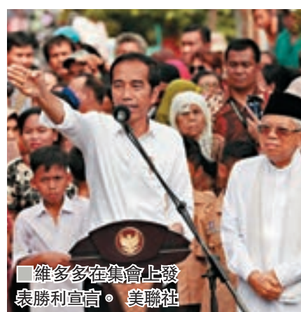
維多多在集會上發表勝利宣言。