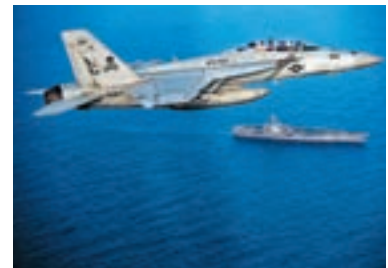
特朗普在中東地區部署航空母艦戰鬥群，但分析指他無意開戰。