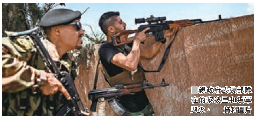
親政府武裝部隊在的黎波里和叛軍交火。資料圖片

當地獲聯合國支持的民族團結政府(GNA)。民族團結政府指，襲擊供水設施的組織領袖埃奈什赫爾希夫塔，但LNA否認該說法。聯合國人道事務協調員里羅譴責今次事件，強調襲擊針對平民生存的基礎，可能構成戰爭罪行。