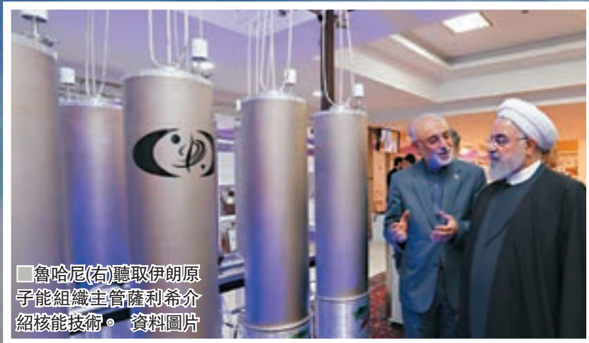
魯哈尼(右)聽取伊朗原子能組織主管薩利希介紹核能技術。資料圖片

伊朗原子能組織前日宣佈，大幅提升濃縮鈾產量至原來的4倍，預料濃縮鈾庫存量將於短期內超出核協議要求的上限，但濃度不會提高，伊朗也不會增加離心機設施。美國總統特朗普前日一改強硬態度，宣稱有意跟伊朗談判，但遭伊朗總統魯哈尼拒絕，魯哈尼批評美國對伊朗發動經濟戰，所有伊朗官員已達成共識，面對美國制裁的唯一選擇便是抗爭。