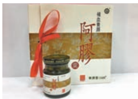
■華潤堂涉嫌非法管有一款名為「阿膠羹」的未經註冊中成藥。

亞洲其他地區方面，新加坡外派人員的整體薪酬組合按年增加逾1.3萬美元至逾23.6萬美元，但新加坡的個人稅率較低，因此在排行榜上的40個國家或地區之中只居第十九位，僱主派遣員工到當地時的成本相對較低。