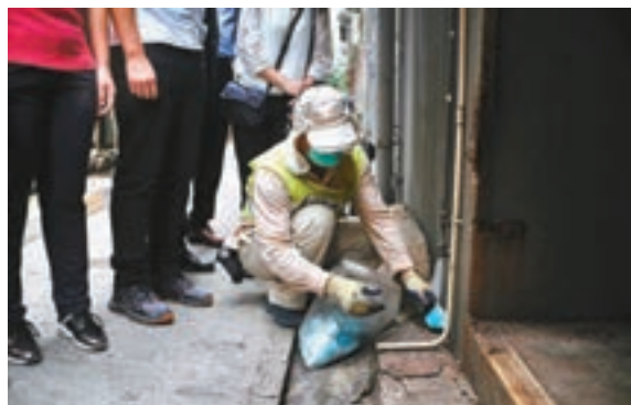
食環署人員在後巷放置老鼠藥。