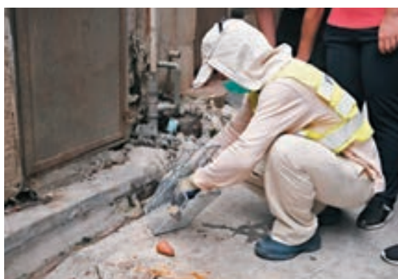
食環署人員設置老鼠籠。