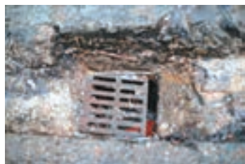
▲深水埗街道渠面見破損。