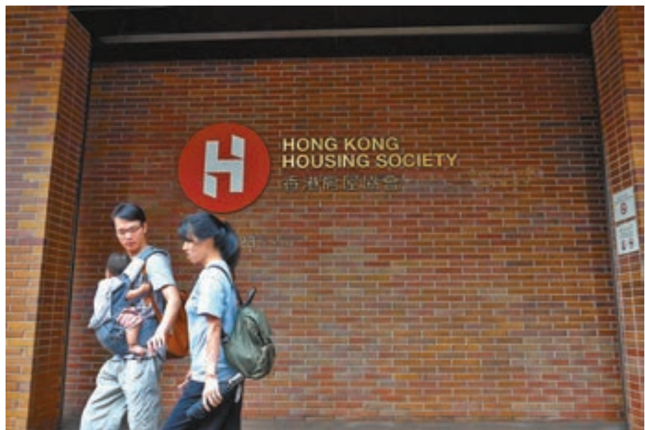
房協擬放寬「未補價資助出售房屋出租計劃」，容許業主出租整個單位。圖為房協總部外觀。

香港文匯報訊（記者 費小燁）房協於去年9月推出「未補價資助出售房屋出租計劃」，容許未補地價單位的業主，分租睡房予輪候公屋3年或以上人士以紓緩公屋供應不足情況，惟反應未如理想，至今仍未出現首宗成功出租個案。有消息指出，房協計劃放寬至可出租整個單位，並建議擴展至房委會轄下的居屋及出售公屋單位，令合資格單位數目增至41萬個，租金由業主自訂，預計下月獲房委會通過後會正式公佈。