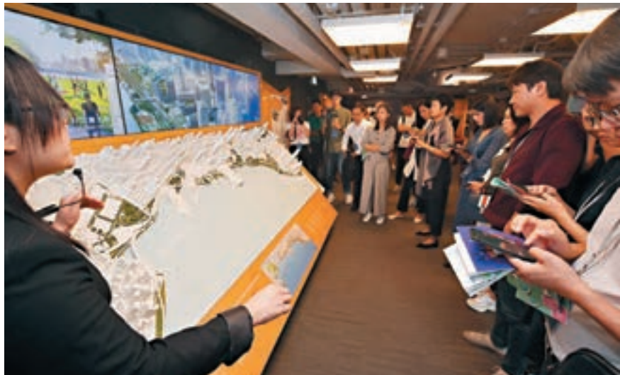
▲採訪團仔細聆聽講解。