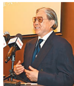
▲霍震霆

幾十年的快速發展造成不少大城市越發趨於同質化，但是建築一旦建起來就很難拆除，現在中小城市要做的反而是保留本地的精神風貌。