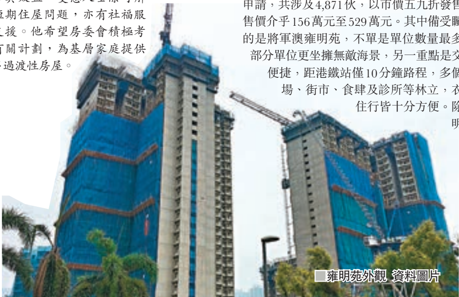
雍明苑外觀 資料圖片

同期推出的文田冠德苑、長沙灣凱德苑及葵涌尚文苑，均距離港鐵站不足10分鐘步程，且附近配套完善。由於何文田屬傳統豪宅區，擁小學34校網優勢，又鄰近港鐵站，故冠德苑被視為「居屋王」。今期居屋本月30日至下月12日接受申請，8月進行攪珠，11月揀樓。申請者可於房委會樂富富務中心提交申請後，房委會亦首次接受網上申請，錄表申請者於網上申請後，仍需要與所屬屋邨辦事處聯絡以確認購買居屋後交回公屋單位。